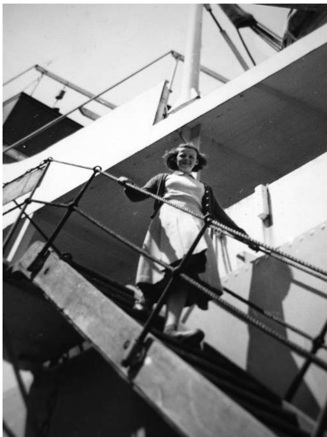
Bibbi på väg!