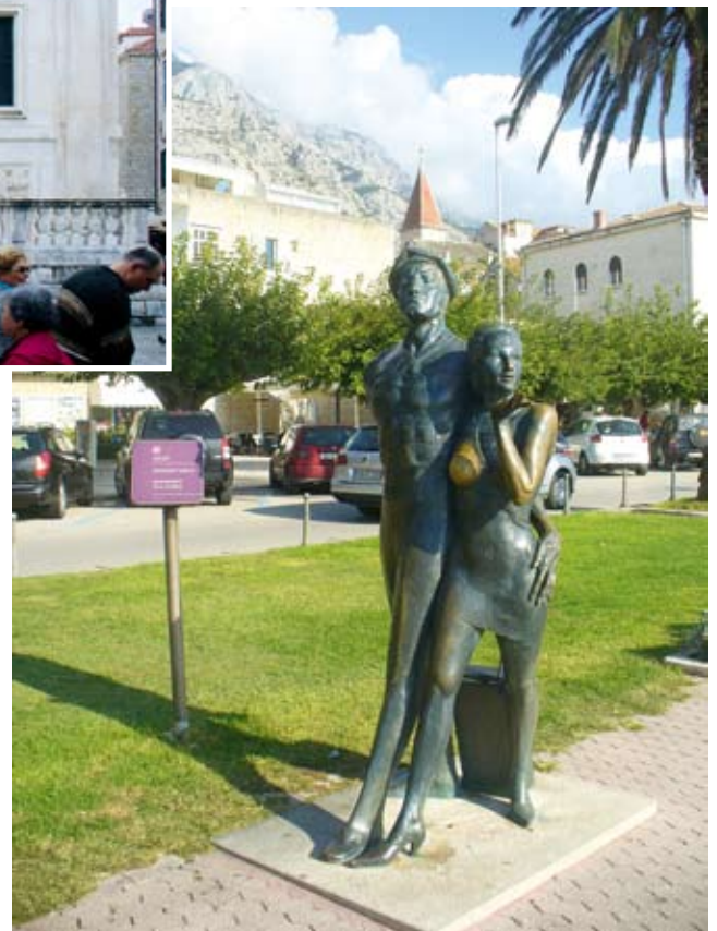
Sjömannen och flickan