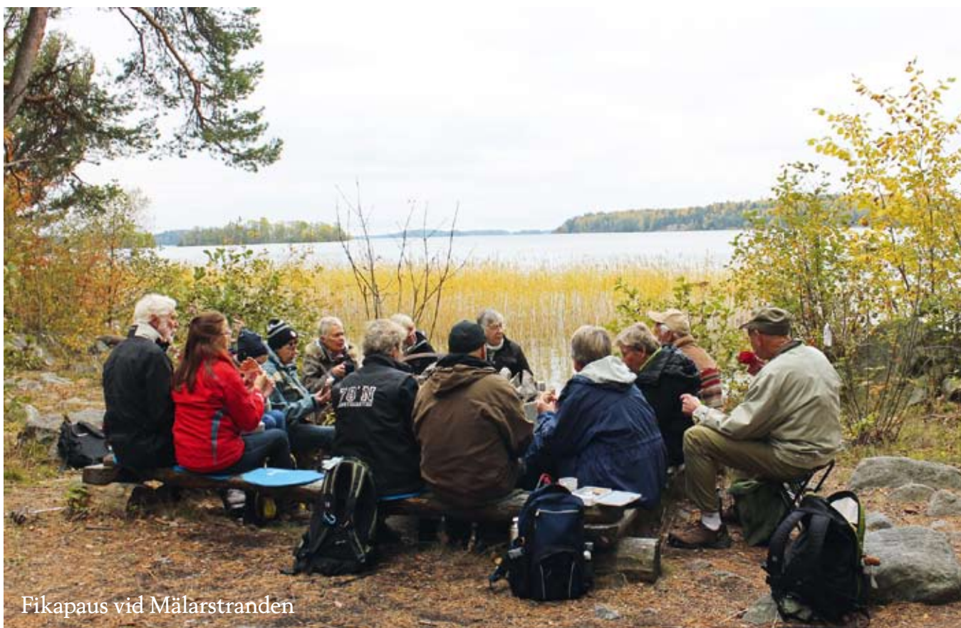
Fikapaus vid Mälarstranden