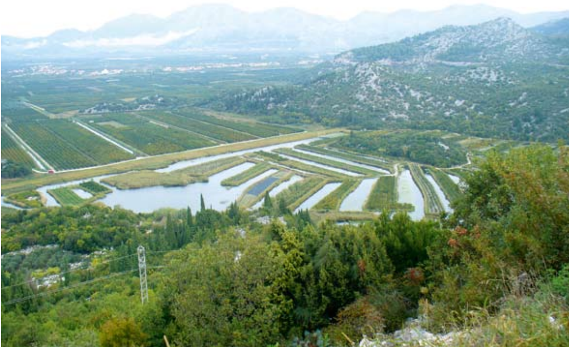
Odlingar vid floden Neretva