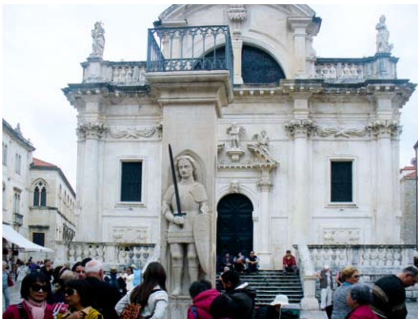
Katedralen i Dubovnik