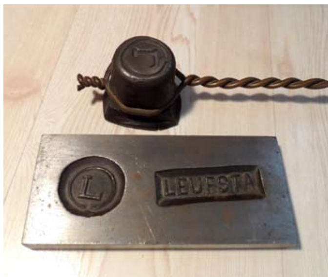
Bilden visar hur det tillverkade stålet märktes samt en av stämplarna.