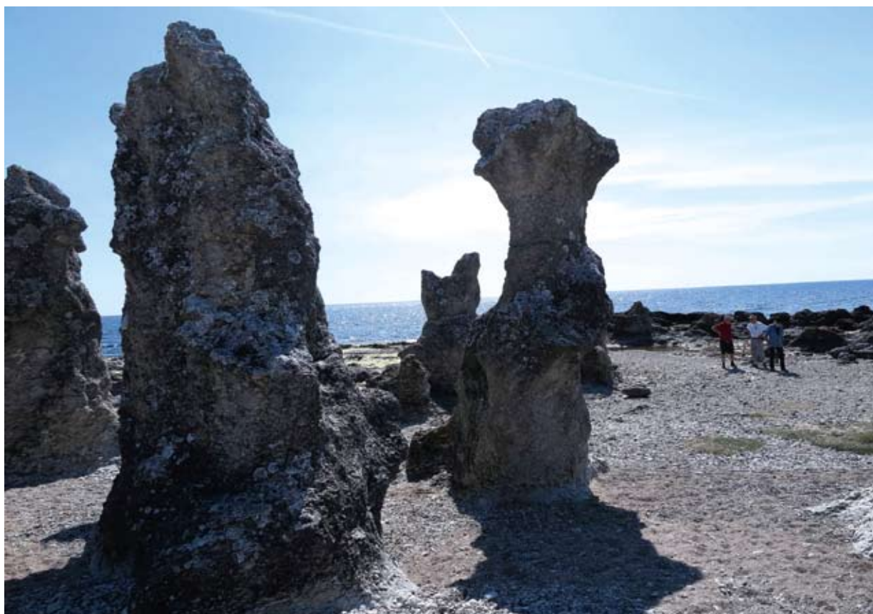
Raukar vid Ljugarn