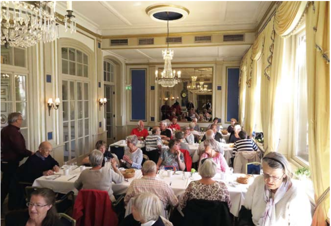
Lunch på Grand Hôtel