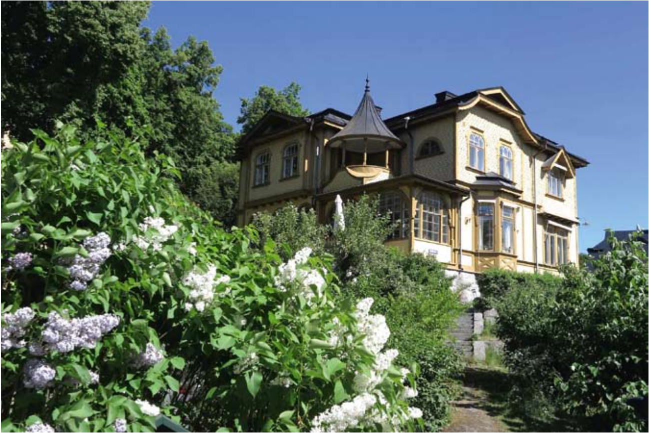
En av Sjuvillorna