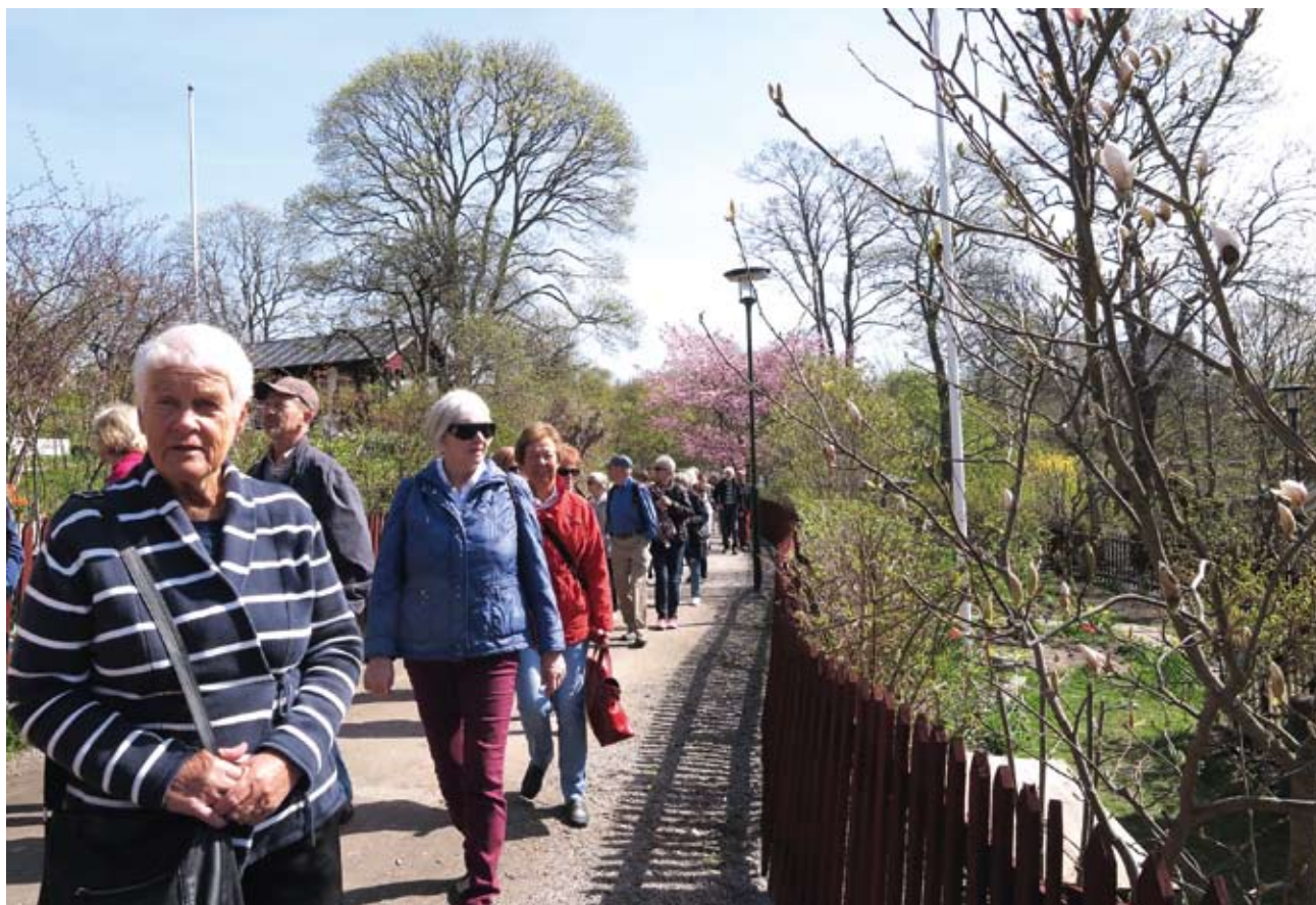
Promenad bland koloniträdgårdar