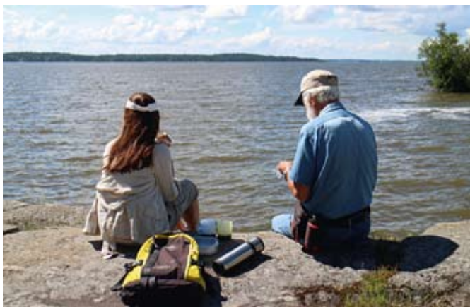
Kaffe när det smakar som bäst!

Viss köbildning uppstod i dörren till caféet när merparten av oss beställde de goda räksmörgåsarna som de är kända för.