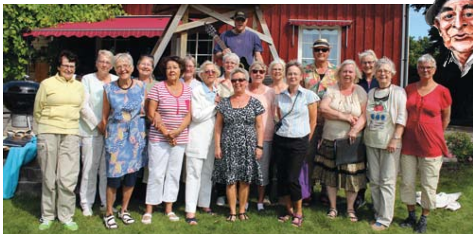
Kulturarrangemang i samarbete med Studieförbundet Vuxenskolan.