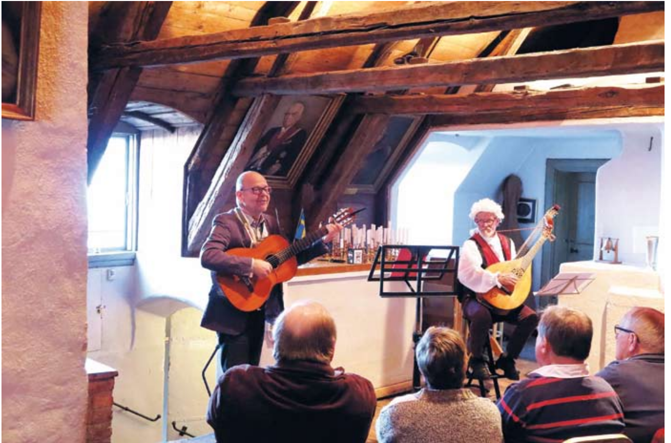
Två trubadurer i samarbete