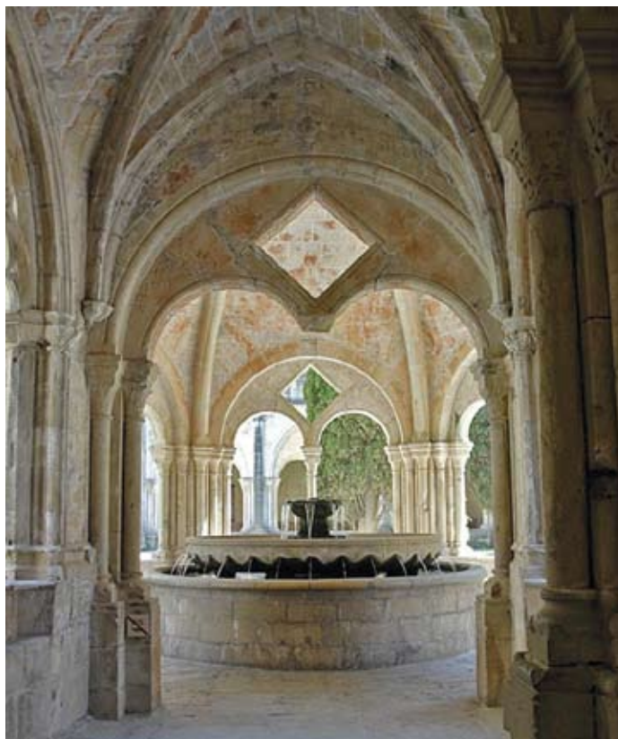
Lavatorium Santa Maria de Poblet