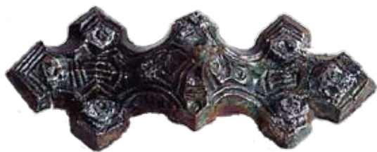
Bronsspänne från kvinnograv i Sanda, Låssa.