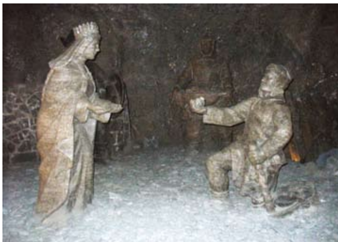
Saltstoder i gruvan

Endast någon mil utanför Krakow ligger Wieliczka saltgruva. Där har brutits salt från 1200-talet fram till 1996, och gruvan är nu ett museum med status som UNESCOs världsarv.