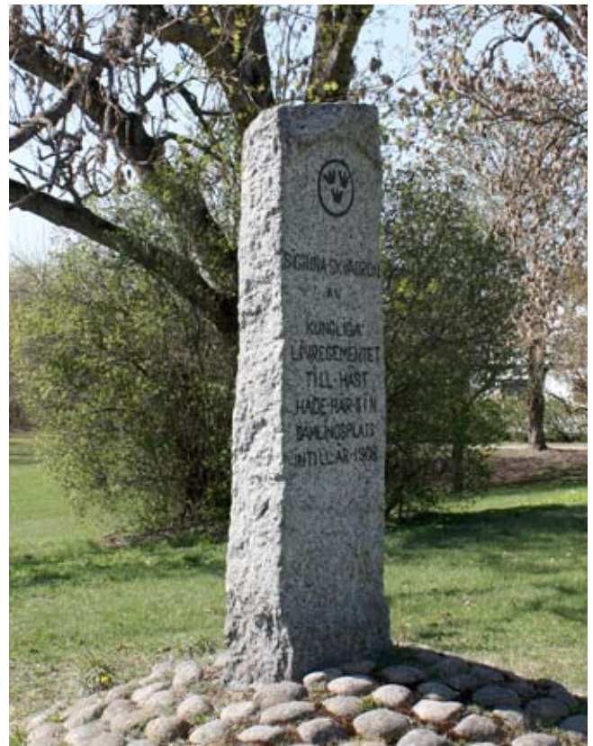
Sigtuna skvadrons sten. Finns i Bålsta i Yttergrans socken och restes 1931.

Arrangemang i samarbete med Studieförbundet Vuxenskolan