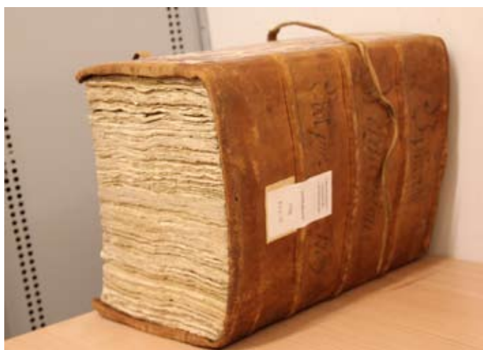
Länsstyrelsens verifikationer för 1709

Vi fick en liten stund att studera materialet med vita vantar på händerna. Närmast på bordet foton av "tjufvar".