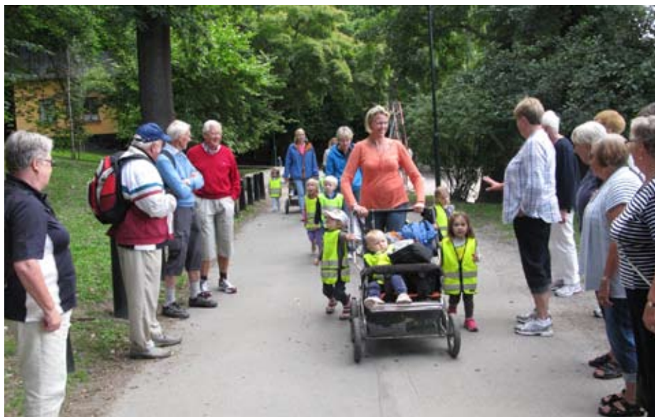
Generationsmöte på Djurgården