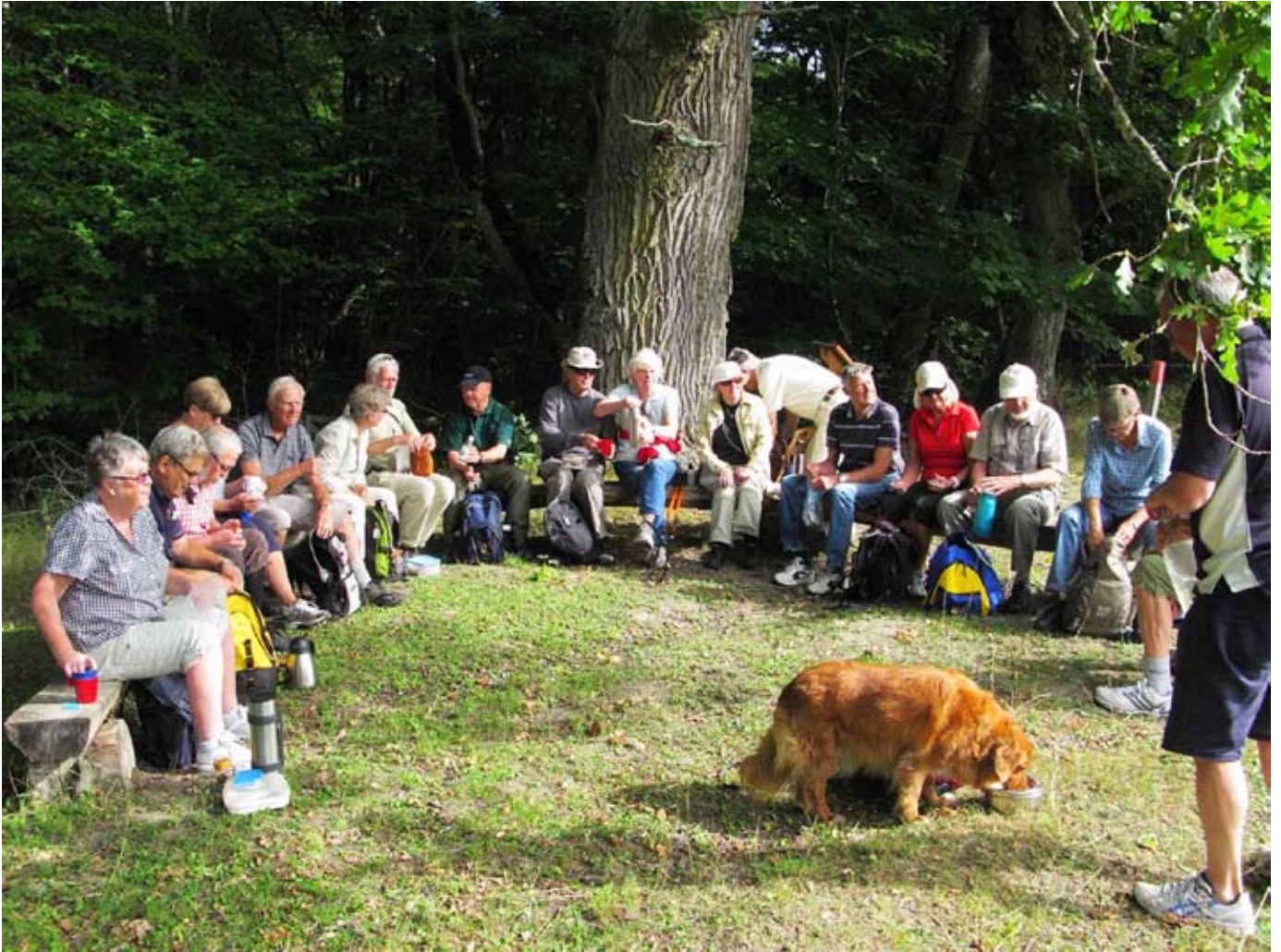
Lastberget och Vattunöden.