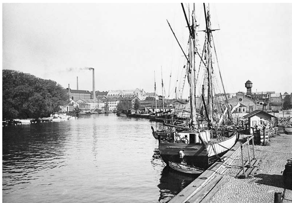
Vedskutor i Klara sjö.