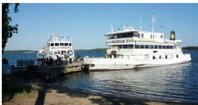
Siverpilen och Waxholm II

Klockan 13 äter vi lunch på Utö Vårdshus, där det serveras strömming. (Finns möjlighet till alternativ rätt.)