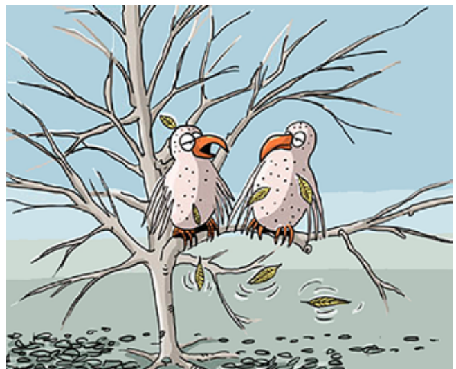
Något på SPF i höst?

Gillar du att skriva? Vänd dig till redaktionen!