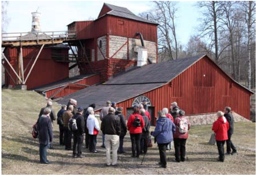
Engelsbergs bruk & Elsa Anderssons konditori