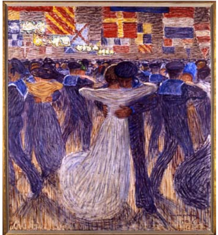
Matrosbal 1912 Eugène Jansson, 1862-1915, olja på duk.