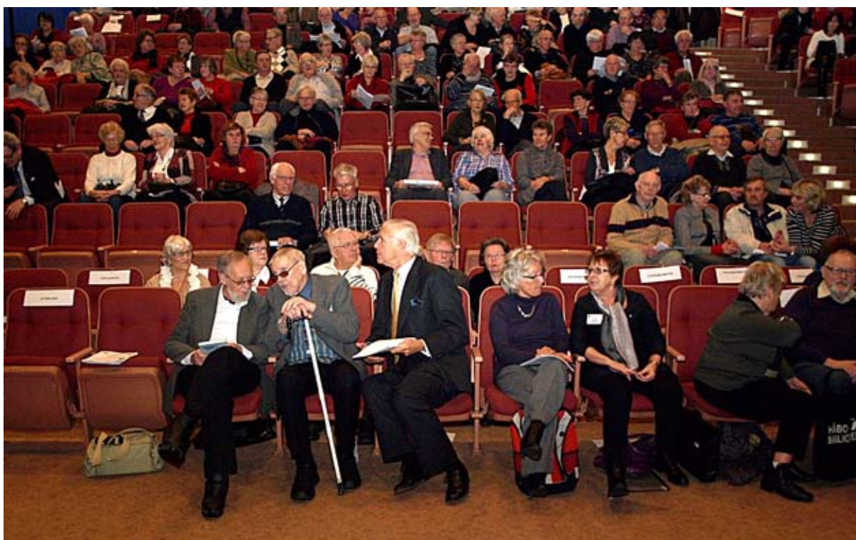
Deltagarna samlas i Fridegårdsskolans aula

På grund av den höga tillströmningen av medlemmar som önskade delta i årsmötet, flyttades detta till Fridegårdsskolans aula. Således fylldes lokalen av mer än 200 personer den 17 februari.