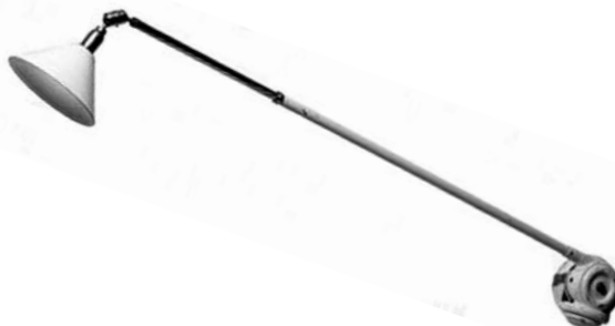
Triplexlampan och Fanna 1918.