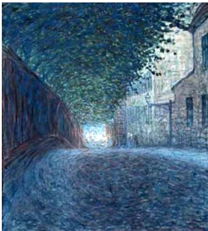
Eguène Jansson (1862-1915)