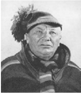
Nils Nilsson Skum

I Naturvårdsverkets sessionssal hängde på 1980-talet en målning av den mest kände samekonstnären, nämligen Nils Nilsson Skum. Målningen föreställer en liten, grå lada där en renhjord passerar alldeles förbi. Bredvid renhjorden åker en same på skidor och litet längre fram springer en liten, svart lapphund.