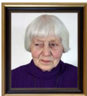
Margith från 1987

Övriga deltagare i redaktionscirkeln har växlat genom åren och därmed får vi tillgång till olika kompetenser.