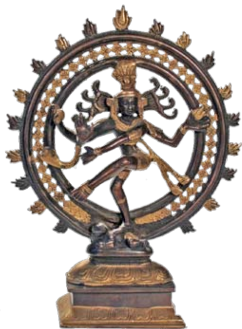
Shiva, en av de högsta gudarna inom hinduismen.