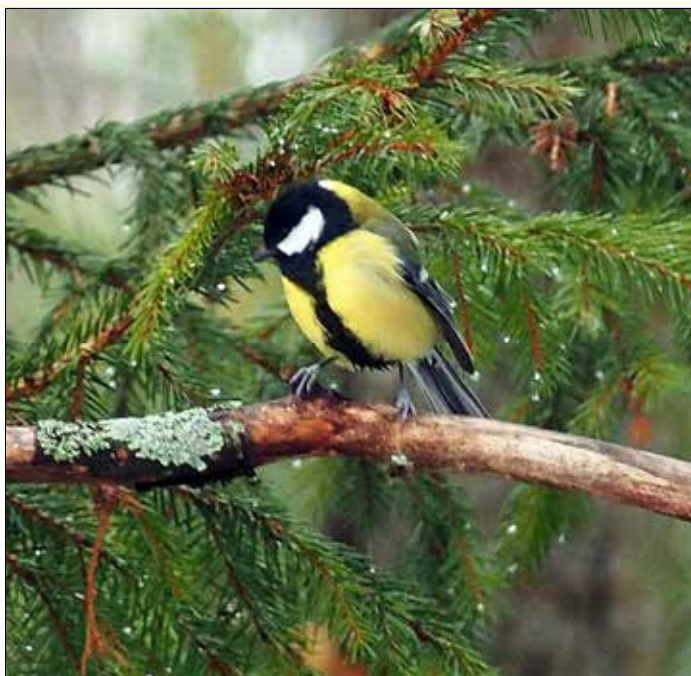
Talgöken – vår vanligaste vinterfågel?