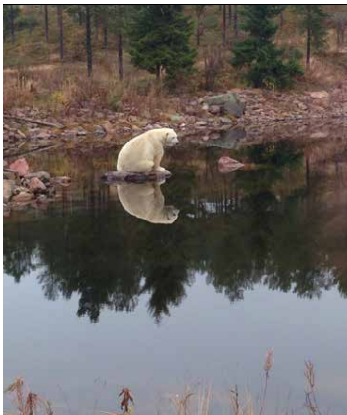
Längtan efter vinterns snö och kyla...