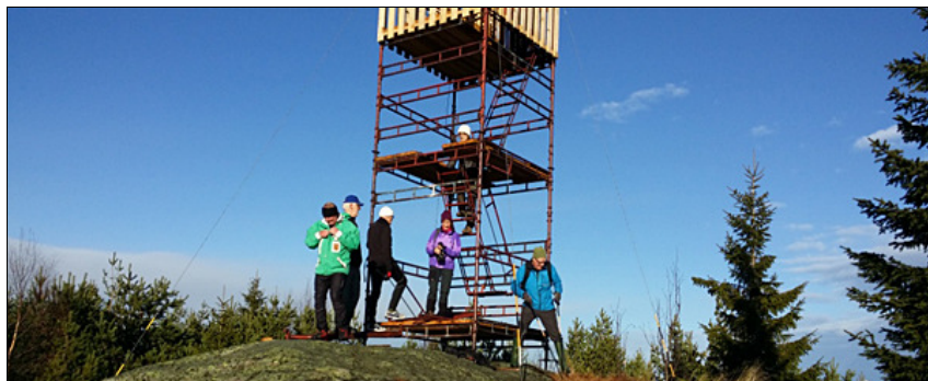
Från Faluns högsta punkt, Spjärshällen, kan man se milsvitt i alla riktningar.

I väntan på skidföre arrangerade skidgänget i SPF Seniorerna under november-december vandringar till olika "höjdpunkter" runt Falun: Spjärshällen, Skuruhäll, Ärtknubben, Trollberget, Hackmorkull och Bondberget/Norlingberg.