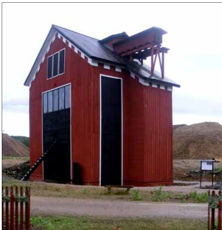
Nyrenoverade Creutz spelhus. Läs mer på sid 42.