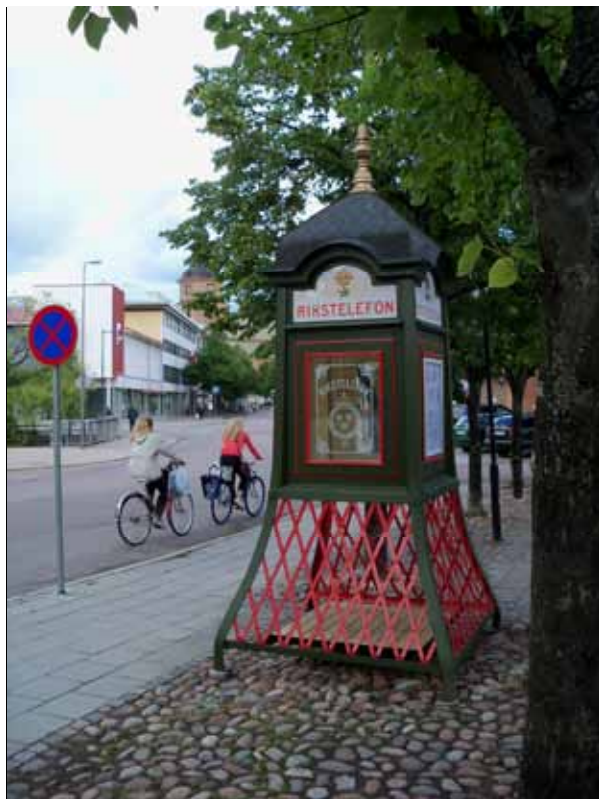
Nygamla telefonkiosken på Hälsingtorget Läs mer på omslagets baksida