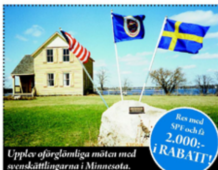
Upplev oförglömliga möten med svenskättlingarna i Minnesota.

På en resa till Island, som många gjort tillsammans med mig, är det naturen som ger de bestående intrycken. Till Svenskybygderna däremot, i Utvandrarernas och i Vilhelm Mobergs fotspår till Minnesota, är det de rörande mötena med dessa svenskättlingar man minns längst efter hemkomsten. Och det är nu man ska göra denna resa; det kommer aldrig att bli detsamma att bli guidad av någon yngre guide utan svenskanknytning som det är med dessa riktiga profiler med egna minnen att föremåla till oss på sin svenska med grammatik från förra sekelskiftet.