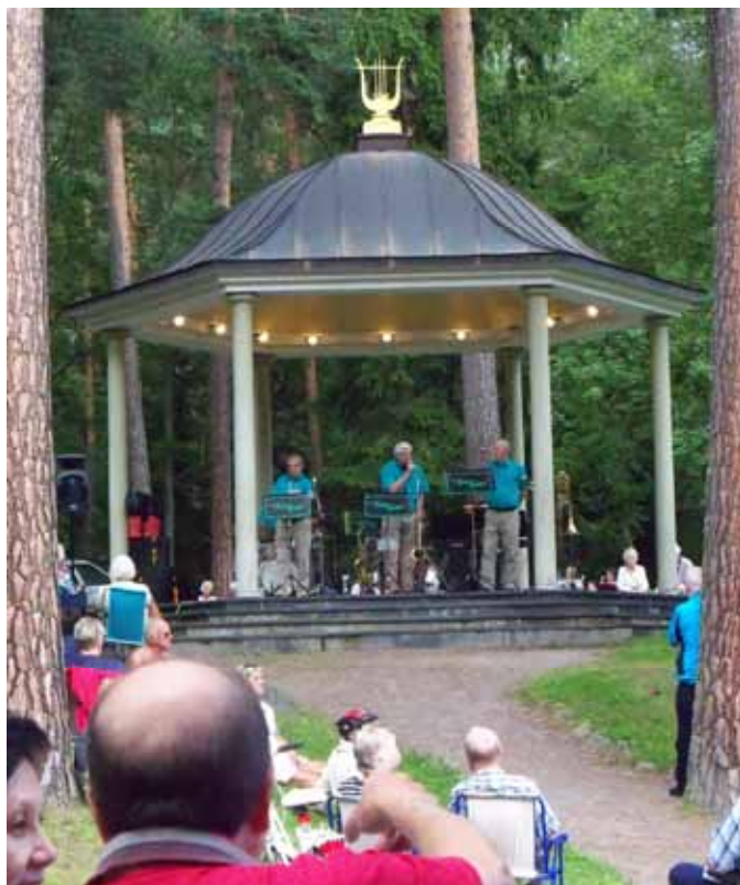
En av de sista sommarkonserterna i Stadsparken