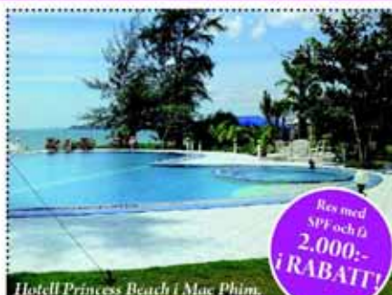
Hotell Princess Beach i Mae Phim.

I resans pris ingår också en halvdags naturutfärd, shopping- och middagstutfärd till shoppingcentra i staden Rayong och middag på den unika regnskogsrestaurangen "Larnpanpan", utfärd till fruktodling, tempel och kvällsmarknad samt utfärd till en flod där vi upplever "skådespelet" med eldflyger (fireflies).