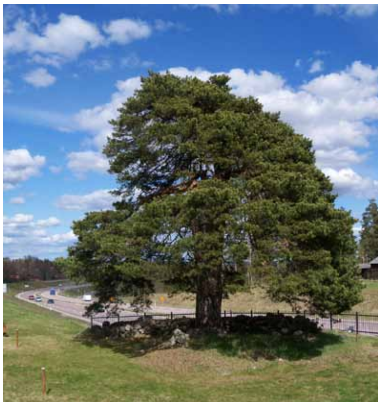
Historiska Suptallen som saknar information. Se sidan 35.