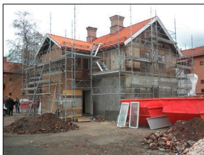
I huset på bilden blir det en lägenhet, 3 r o k, på övervåningen och i hela bottenvåningen blir det gemensamhetslokaler.

Yxhammargatan kommer att bestå av två nybyggda hus på fyra våningar med källare samt ett om-