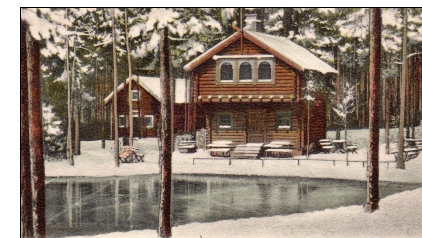
En vy som vi känner igen, den lilla dammen och huset i stadsparken på en bild från 1905, inte så olikt som det ser ut idag.