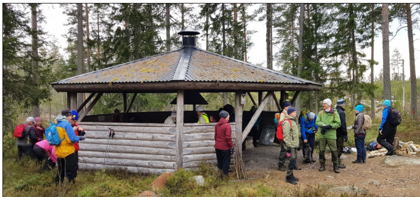
Sista vandringen kom vi till "Dansbanan" vid Djuptjärn. En sinnrik konstruktion som byggts på uppdrag av Stora för representationsjakt under 90-talet.