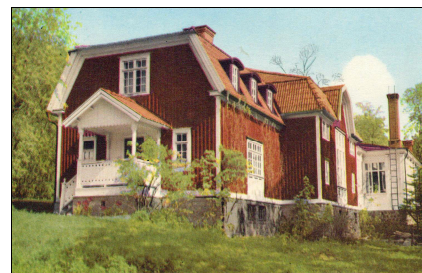
Här på Villavägen bodde Selma Lagerlöf 1907–1910. Huset revs på 1960-talet, trots protester.