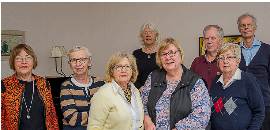
Ny styrelse 2016.