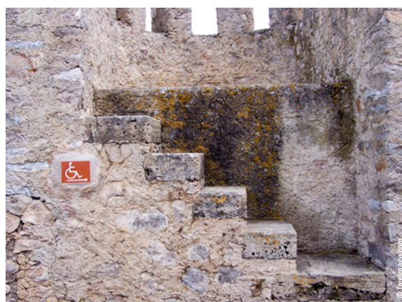
Tillgänglighet för alla är målet.

lighet regleras i ett flertal konventioner, från FN, via EU etc till SL:s egna regler, samt utifrån synpunkter från intresseorganisationer. Målet är att kollektivtrafiken ska upplevas som det mest attraktiva