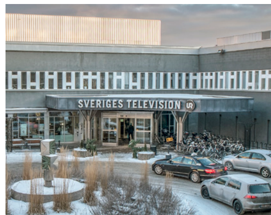
TV-husets entré på SVT.

I TV-husets stora ateljé görs studiomiljöer och scenarrangemang. Här hade omfattande arbeten just gjorts med rekvisita för melodifestivalen. Studiomiljöerna kan i