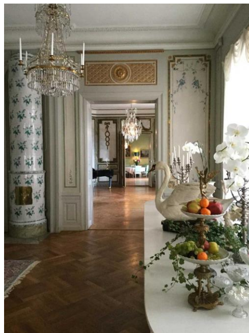
Mellandagar på sturehovs slott.

Öppet alla dagar 26/12 - 9/1 (ej 31/12 & 1/1) Mer info på