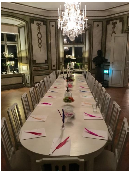
Konferens och möten