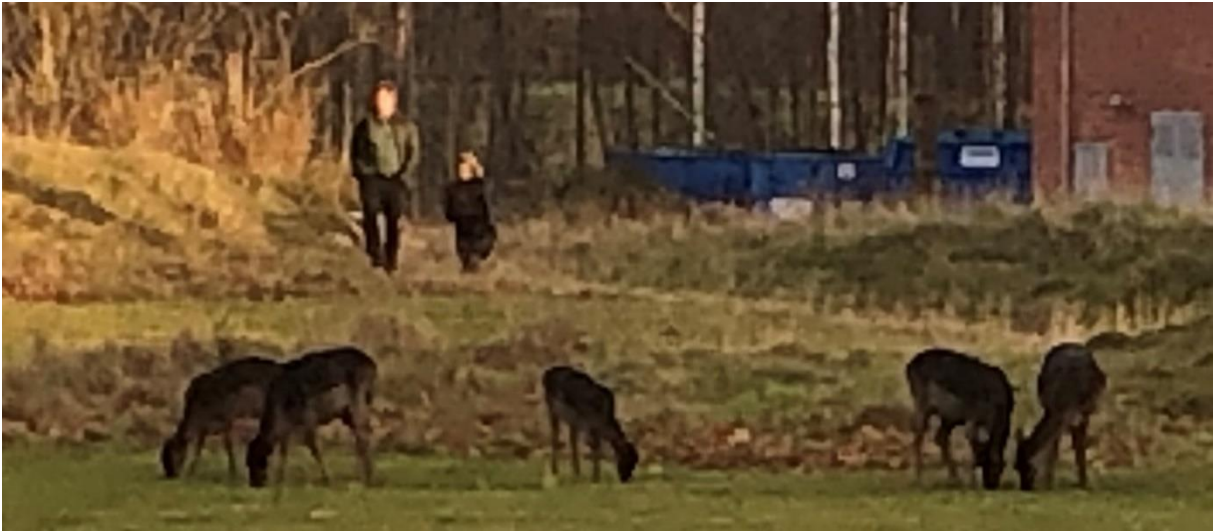
Dovhjortar (?) utanför teatern i Brevens Bruk.

stiga av i Flemingsberg, hemma ca en timme försenade. Vi kunde konstatera att dagens tåg är klart tystare, bekvämare och snabbare än de var i vår barndom.