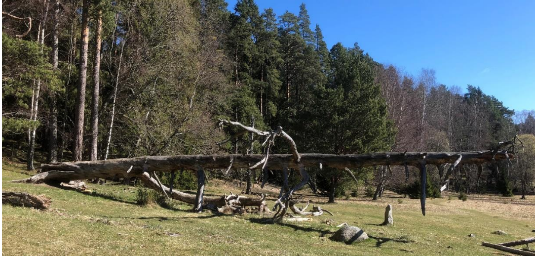
Seniort träd vi mötte på vandringen