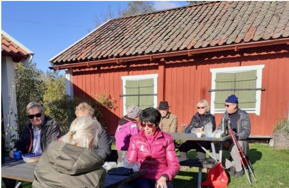
Onsdagsvandrarernas belöning: Trivsamt fikastund

Styrelsen sammanträdde den 14/10, och vi kunde tydligt känna att livet, i detta fall föreningslivet, nu har vaknat ur coronadvalan. Vi måste dock påminna oss att det kan vara bra att fortsätta att vara lite försiktig.