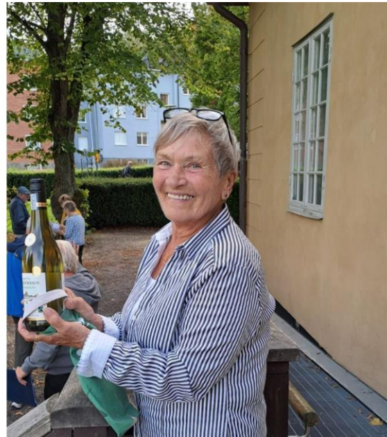
Glada miner under Seniorveckan

Nästan hundra tårtbitar serverades av SPF i samband med Öppet hus i onsdags. Mycket uppskattad efterrätt, liksom den grillade korv som PRO bjöd på.