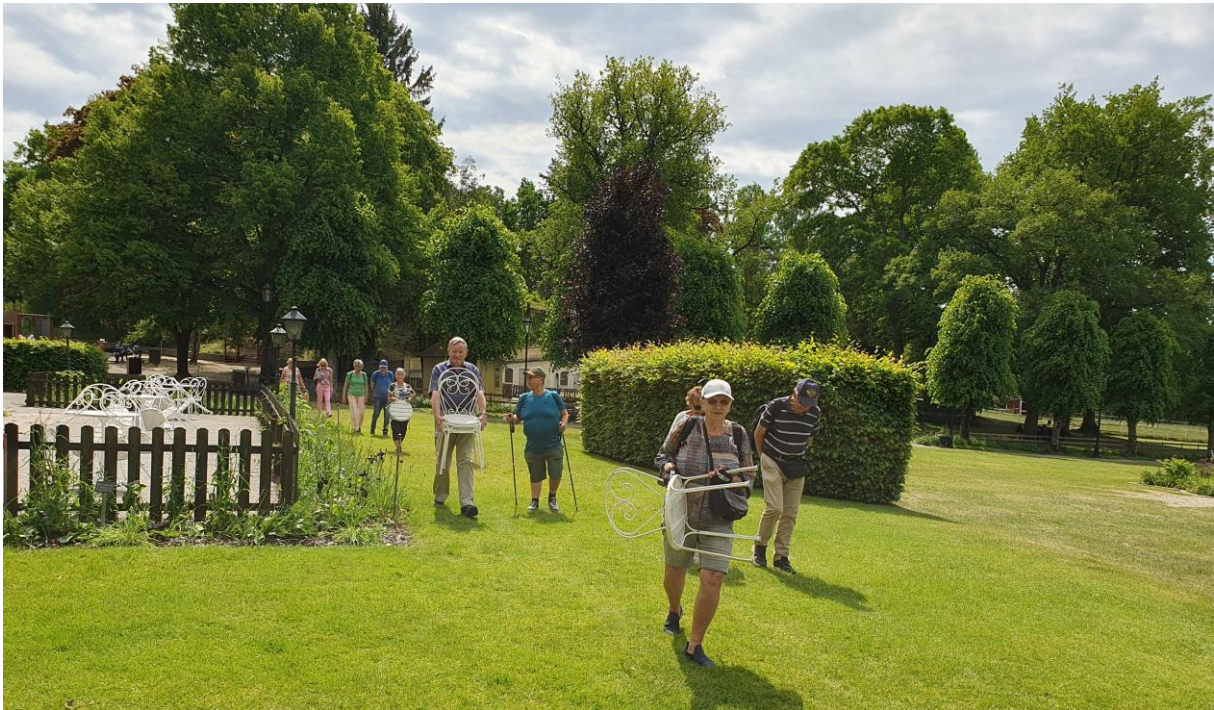
Vi fick lov att hämta extrastolar för att alla deltagare i vandringsavslutningen skulle få sittplats

Här kommer sista veckobrevet före sommaruppehållet. Innan vi tar ledigt vill vi tipsa om några trevliga aktiviteter. OBS att endast den första sker i SPF:s regi, övrigt är förslag på egna aktiviteter: