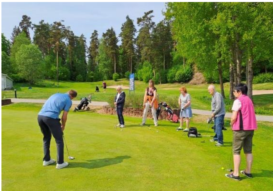
Puttningsträning på Botkyrka GK 31/5