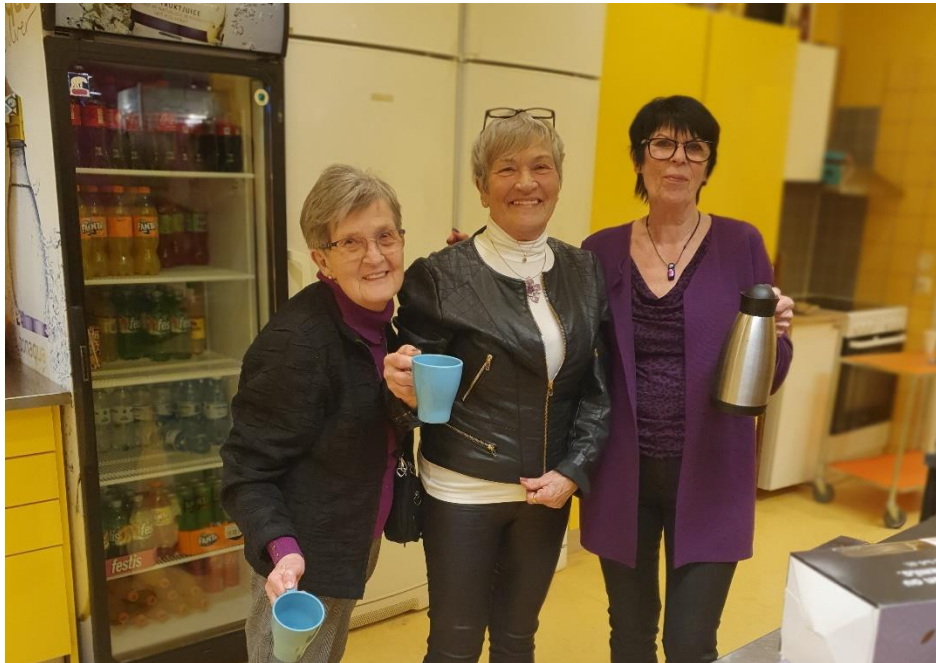
På årsmötet sköttes serveringen och annan service av dessa kompetenta funktionärer.