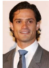
Prins Carl Philip