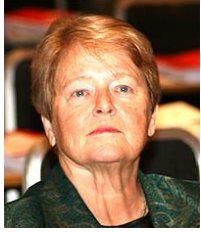
Gro Harlem Brundtland