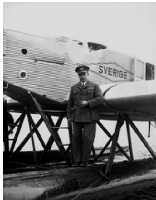
Albin Ahrenberg med flygmaskin

Uppstigningarna skedde från "Koppelhällan" uppströms "Fläskosets" lilla matservering vid Hammarbrons södra landfäste.