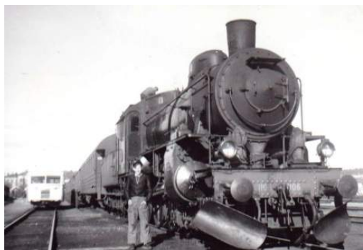
Snälltåget på Ragunda station