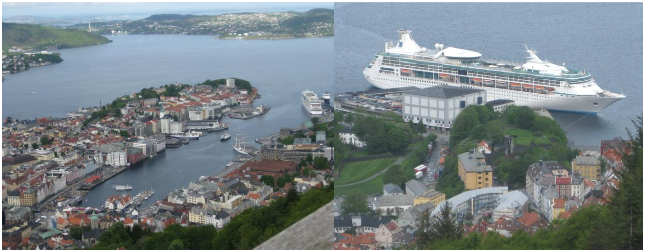
Bergen från linbanan

Vi vaggades till söms av västerhavets och Norska havets vågor och sov skönt fem kvart i timmen hela natten. Vi vaknade med att vi låg för- töjda i Bergens hamn. Nästan på språng till den överdådiga frukosten för att hinna göra Bergen den äran.