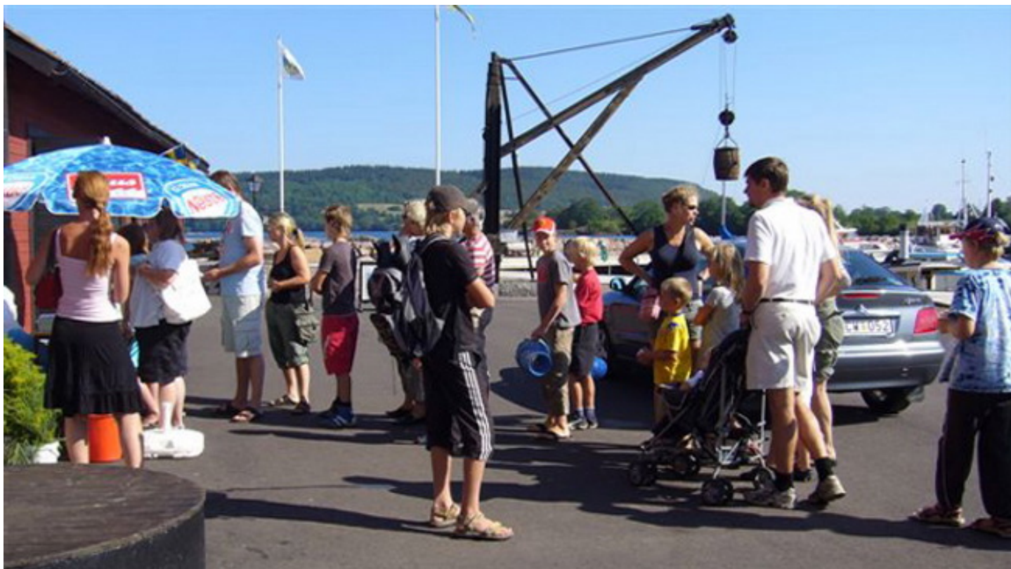
Hästholmens hamn idag

Nästa morgon var den 1:a juni och nya äventyr väntade. Vi skulle nämligen följa med säsongens första båttur mellan Hästholmen och Hjo. Vandrarhemmet tömdes fort på morgonen och den stora cykelanhopningen decimerades i samma takt. Vi var många hojtrampare i sällskap till Hästholmens brygga där båten väntade, dock inte alla nattgäster. Jag minns inte namnet på båten från 1940, men nu 2011 heter den M/S Vadstena.