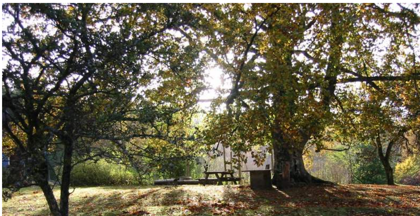
Utsikt över Vättern från Stocklycke Vandrarhem

Det har nog aldrig i världshistorien varit så många kilometer på en mil som den dagen och vi skulle ända till Stocklycke vandrarhem på Omberg innan läggdags. Jag försäkrar; vi sov redan när vi skulle ta backen upp till Ombergs hjassa där vandrarhemmet låg. När vi vaknade till lite extra vid framkomsten kunde vi uppskatta den underbara utsikten över Vätterns stilla böljor i kvällsljuset.