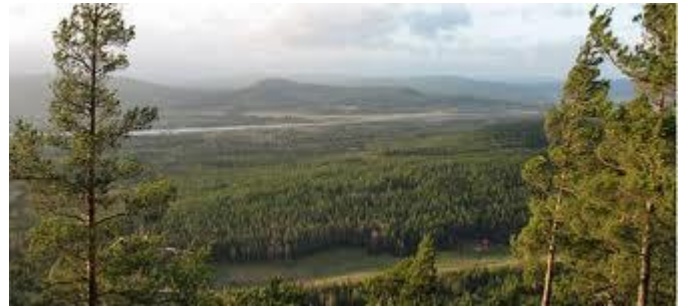
Vy från Järvsö klack

pensionat som var inrymt i manbyggningen. Där tog vi in.