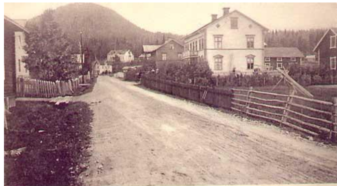
Vy från Ragunda

första affärsresa i hembyn med det oersättliga putsmedlet.