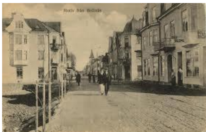
Motiv från Bollnäs

Till Bollnäs kom vi mot aftonen i så god tid att fabrikören kunde gå ut och köpa in lite råvaror och några fler flaskor till fabriken i kartongen, den som jag suttit och hållit fast över mina magra knän under tågresan.