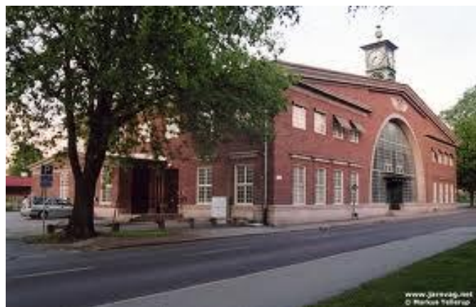
Stationshuset Gävle södra

Nästa anhalt blev Gävle, och den skulle bli min sista, det hade jag bestämt mig för, hur det nu skulle gå till.