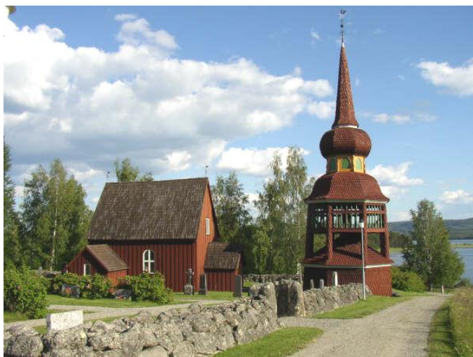
Håsjö gamla kyrka

Tidigt nästa morgon trampade jag iväg på mammas damcykel upp mot Håsjö.