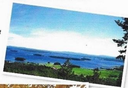
Utsikt från Avholmsberget