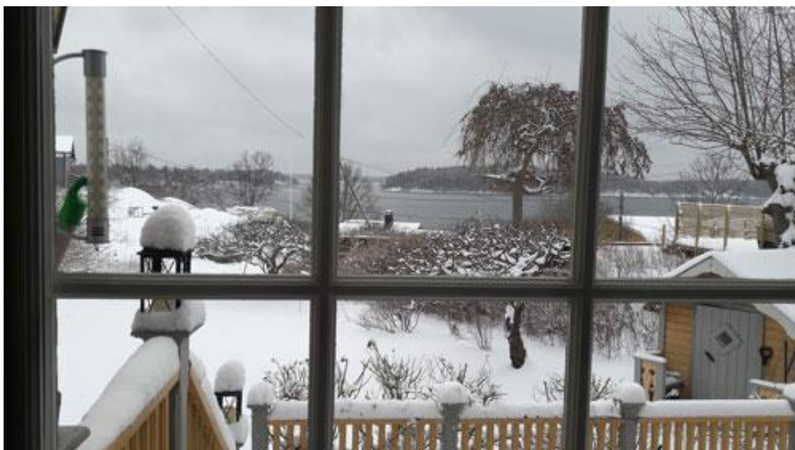
Utsikten från fönstren över Vaxholmsfjärden var bedövande vacker även en sådan här gråmulen dag.