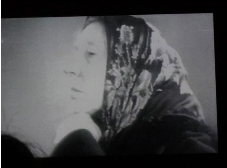
En sidensjalett från Almgrens var förr en statusmarkör.