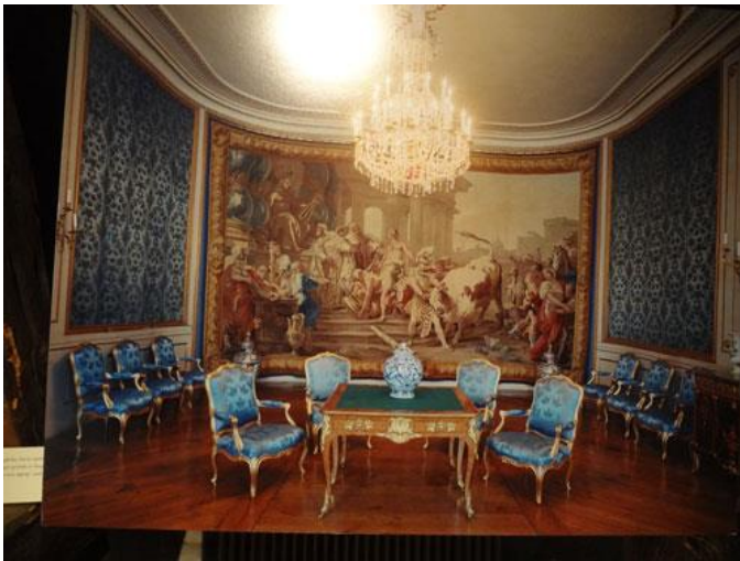
Efter filmvisningen fick vi möjlighet att titta runt i utställningen. Där fanns foton från ståtliga slottssalar med möbelyger vävda hos Almgrens.