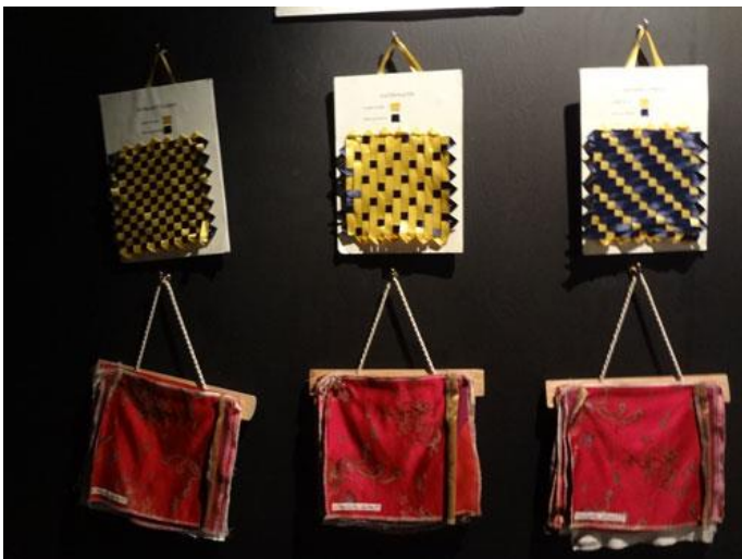
Pedagogiska visningsexempel på olika vävtekniker fanns det också i utställningen.