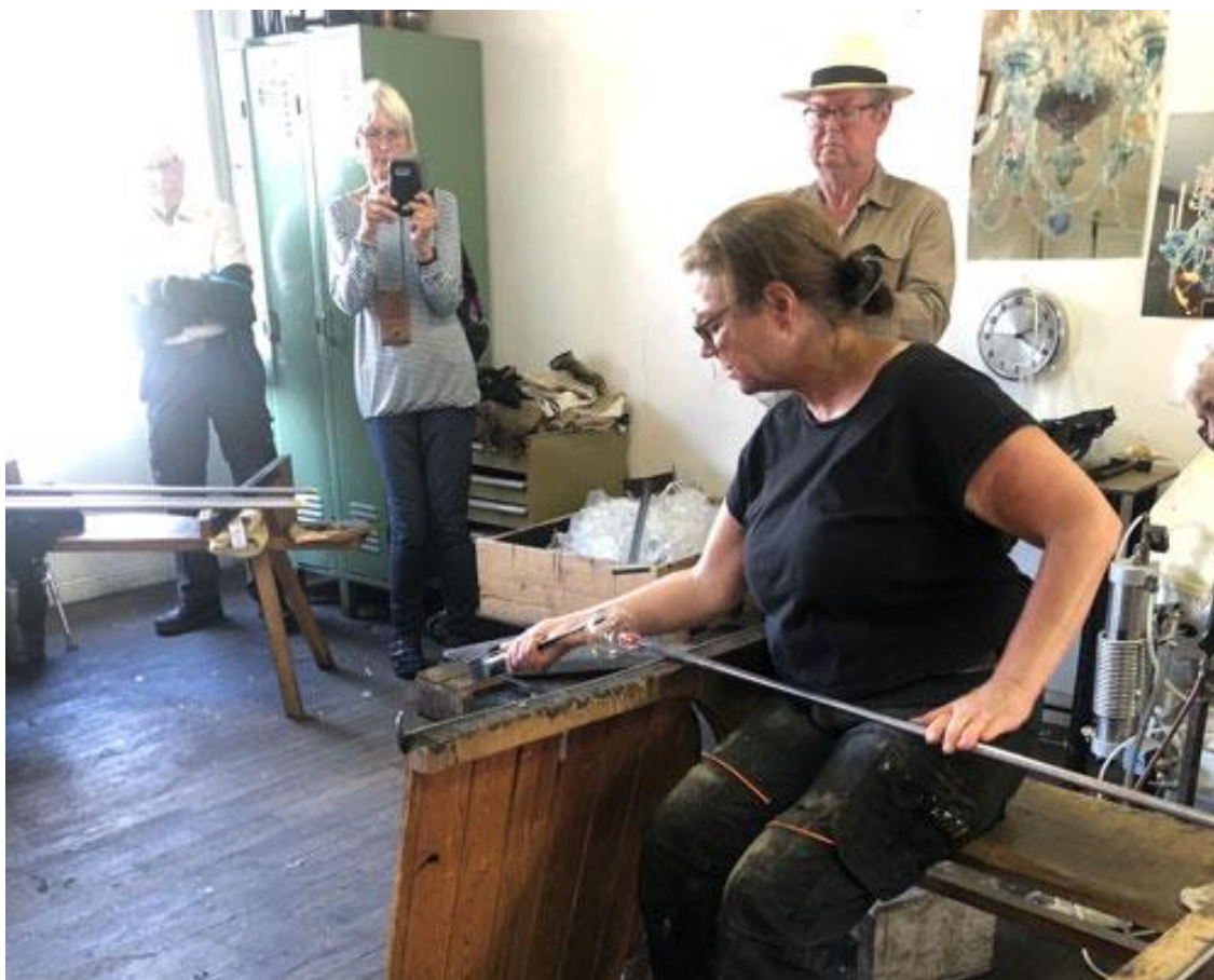
Jobbar med glaset.