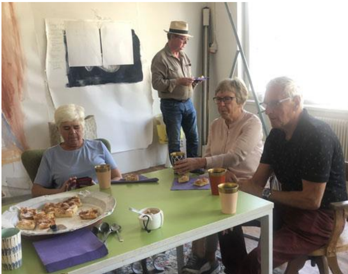
Vi bjuds på kaffe och jättegod äppelkaka efter visningen.