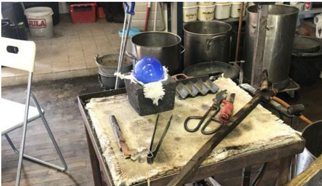
Lite olika hjälpmedel.