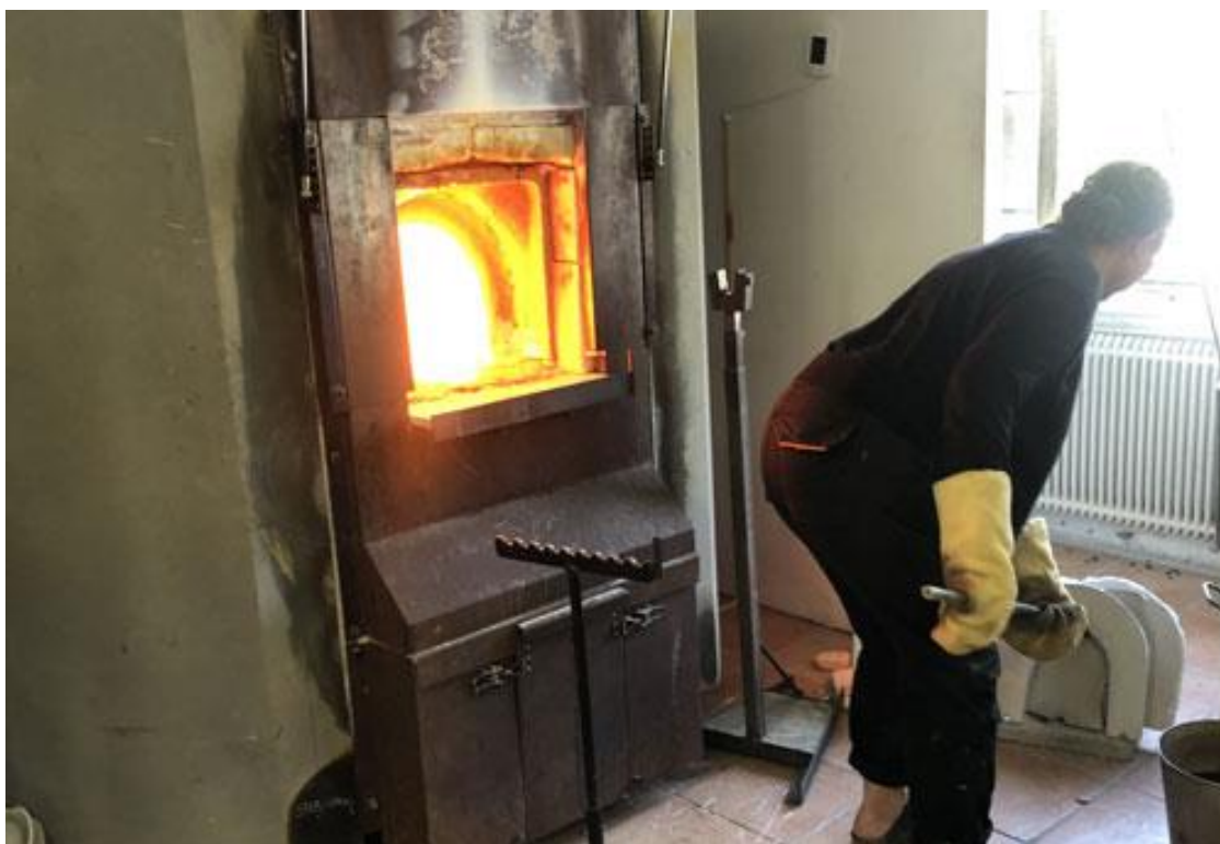
Kollar ugnen, där är det 1125 grader.