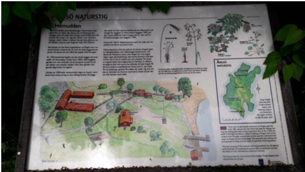
Vi vandrade upp från bryggan till första stoppet på naturstigen, Hemudden.