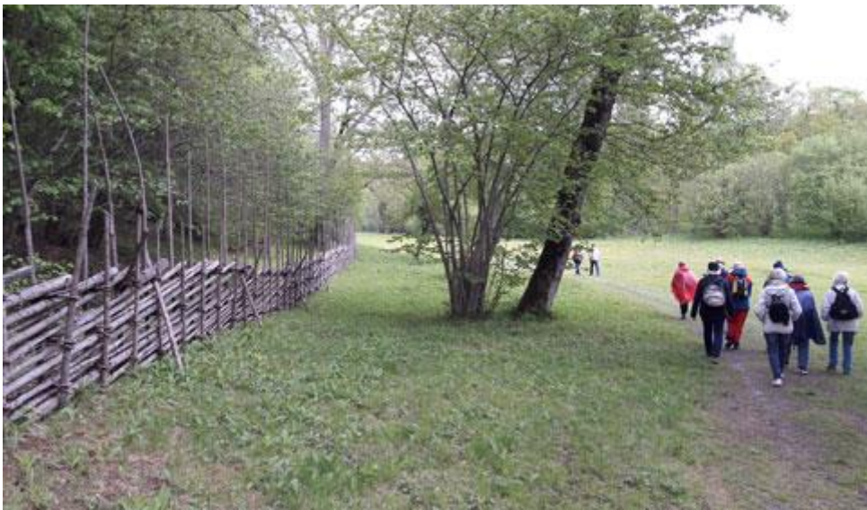
Det finns många kilometer med gärdsgårdar på ön.