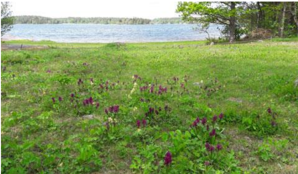
Längst uppe i norr vid Norrudden blommar Adam och Eva vid denna tid på året.