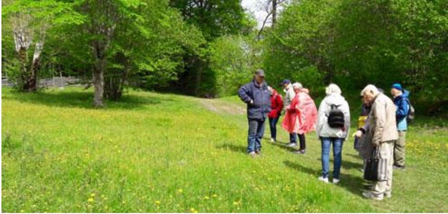
Träden till vänster hamlas fortfarande på gammalt sätt.