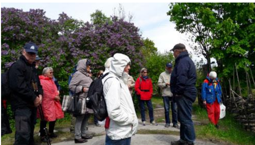
Det hade börjat regna så smått, men det blev som tur var en mycket kort skur.