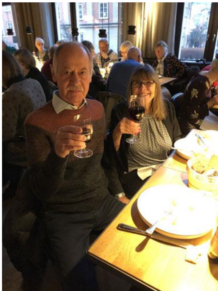
Bilder och text: Margaretha Östling