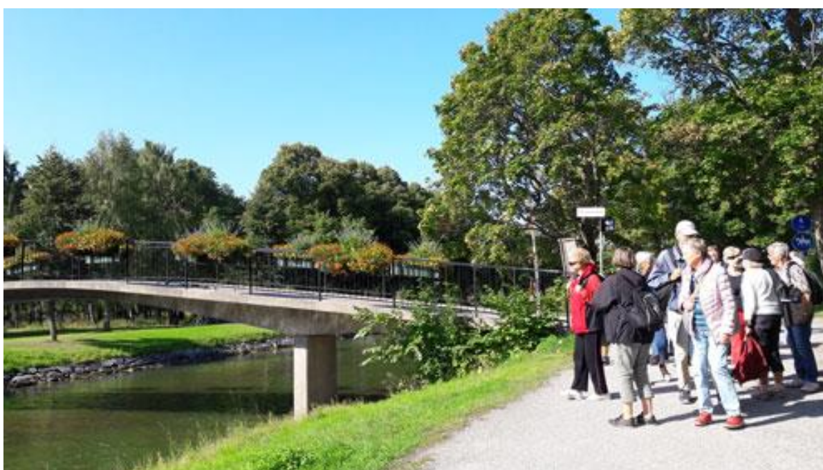
Vid Lilla Sjtullen, vid inloppet i kanalen passerade vi den blomsterprydda bron över till södra sidan av Djurgården...