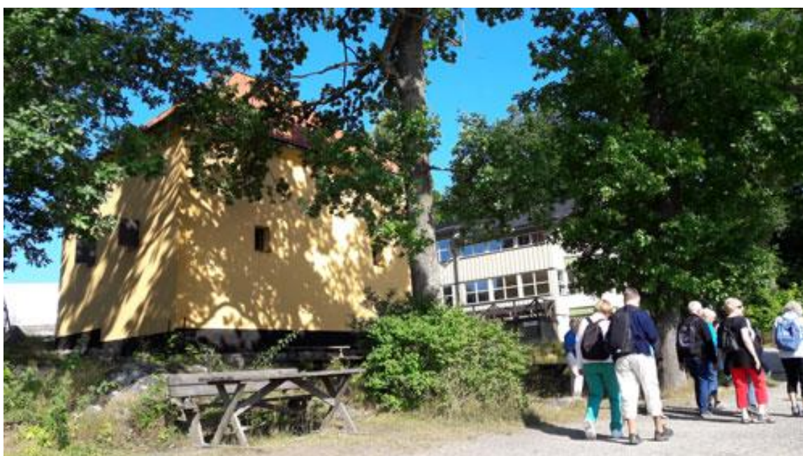
Där ligger också det f.d. Kruthuset med anor från 1600-talet, som nu är servering på vissa tider.