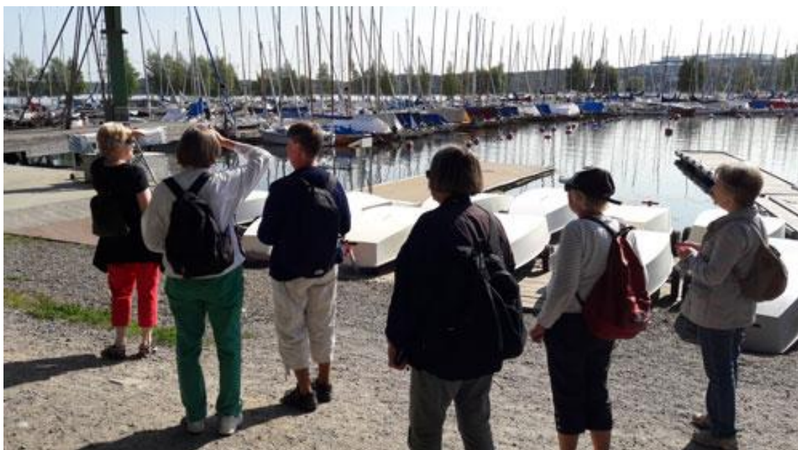
Vid Hunduddens Marina låg det massor av vackra segelbåtar för ankar.