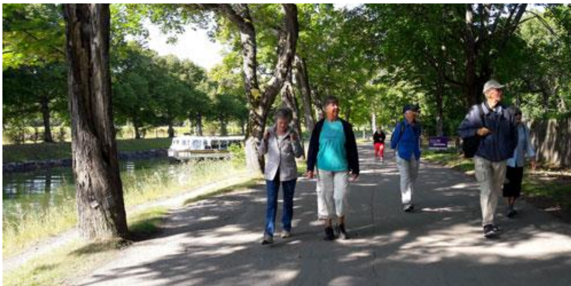
Turistbåtar passerade i den fridfulla förmiddagen.