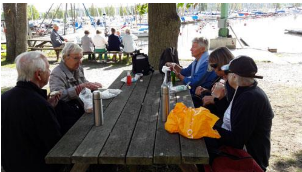
Där fanns det bord och bänkar som lämpade sig för matsäckspaus, även om vi inte hade gått så långt ännu.