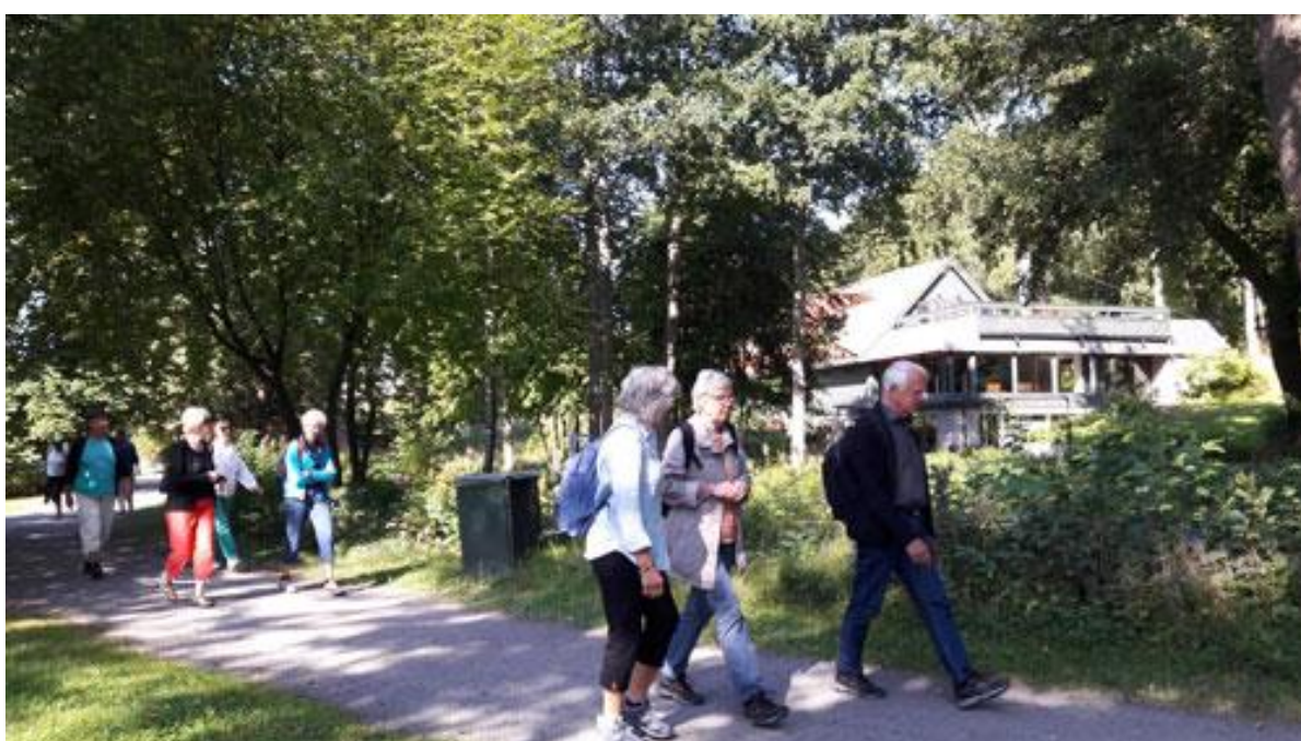
... men vi fortsatte på stigen vidare norrut, mot Hundudden.