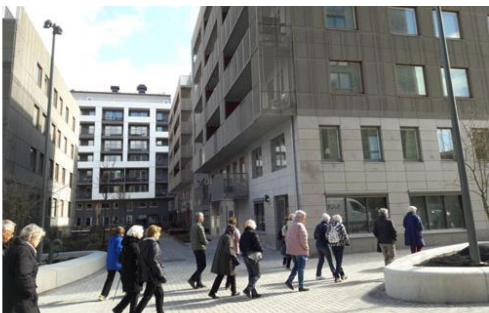
Man bygger tyvärr väldigt tätt med "Stenstaden" som mall på många håll i de nya områdena.