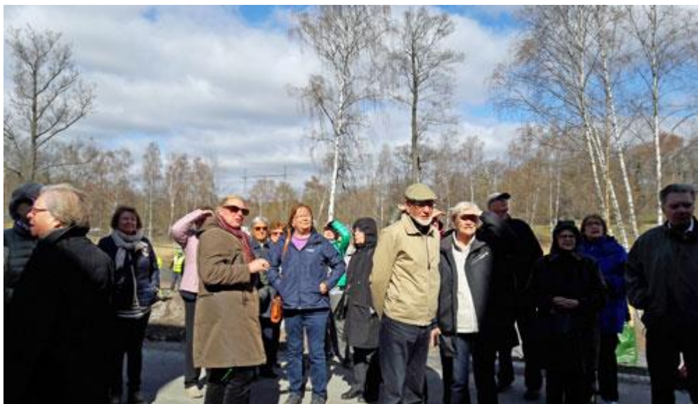
Hon visade oss på en länga med stadsradhus, som kallas Zenhusen p.g.a sin japanska stil. De är med och tävlar om utmärkelsen Årets Stockholmshus 2018.