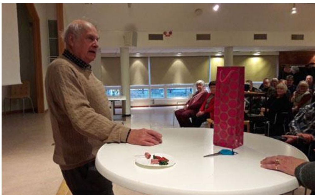
Slutligen avtackades han med en varm applåd och något drickbart, dock inte öl...