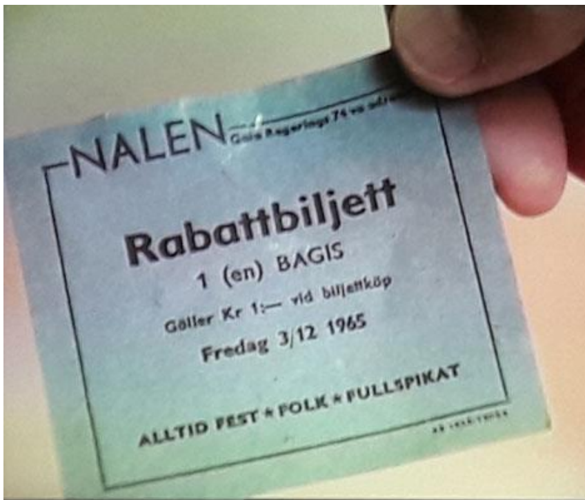
Så här kunde en biljett se ut till Nalen, stället där "allting händer och fötter".