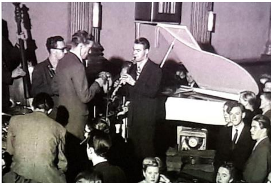
Här är en bild från ett av Puttes framträdanden på Nalen för mer än 50 år sedan.