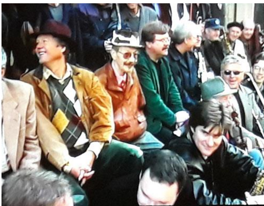
Det var under mycket glam och støj, som de numera lite ålderstigna musikerna radade upp sig för gruppfotot.