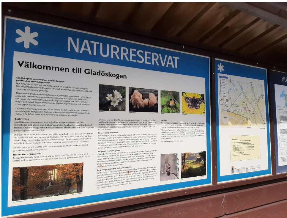
Vi var nu i kanten av ännu ett naturreservat, Gladöskogen.