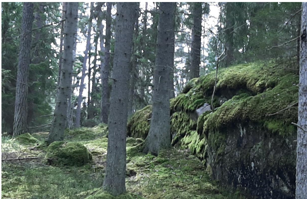
Det var en riktig trollskog en bit in.