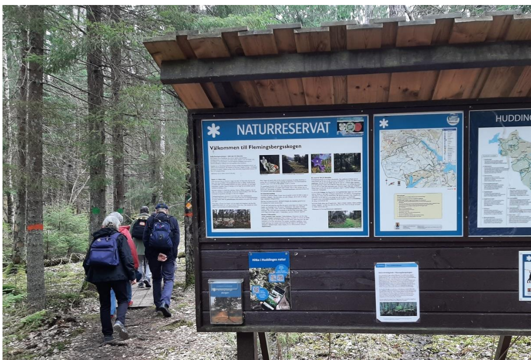
Vi gick en bit av Huddingeleden, som ansluter till Sörmlandsleden.