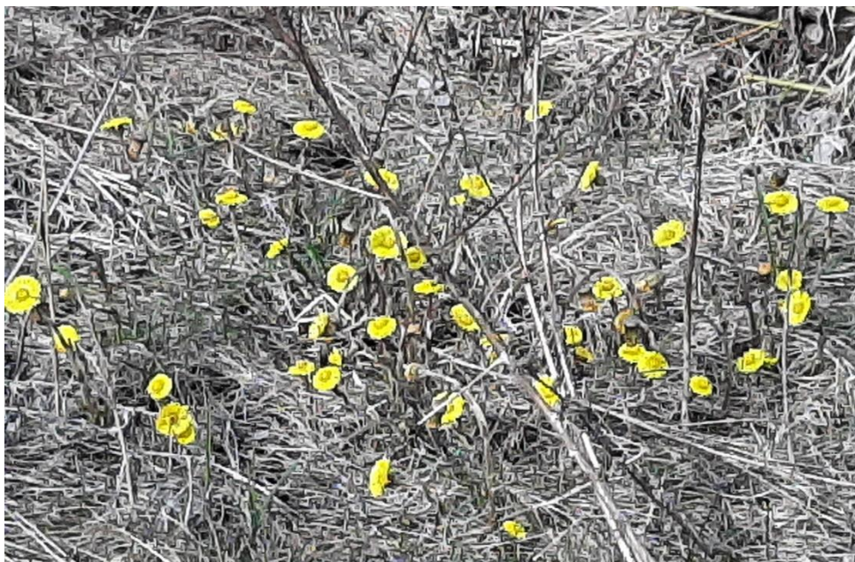
Men vi höll oss till vägen och kunde njuta av massor av Tussilago i dikesrenarna.