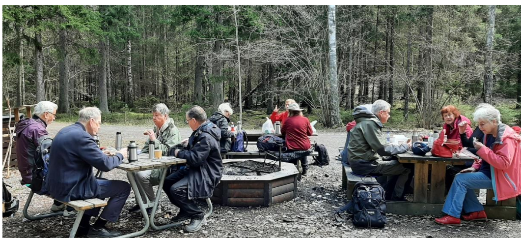
Vi tog en ganska tidig matsäckspaus på en fin rastplats, för det fanns inte så många lämpliga rastplatser längre fram.