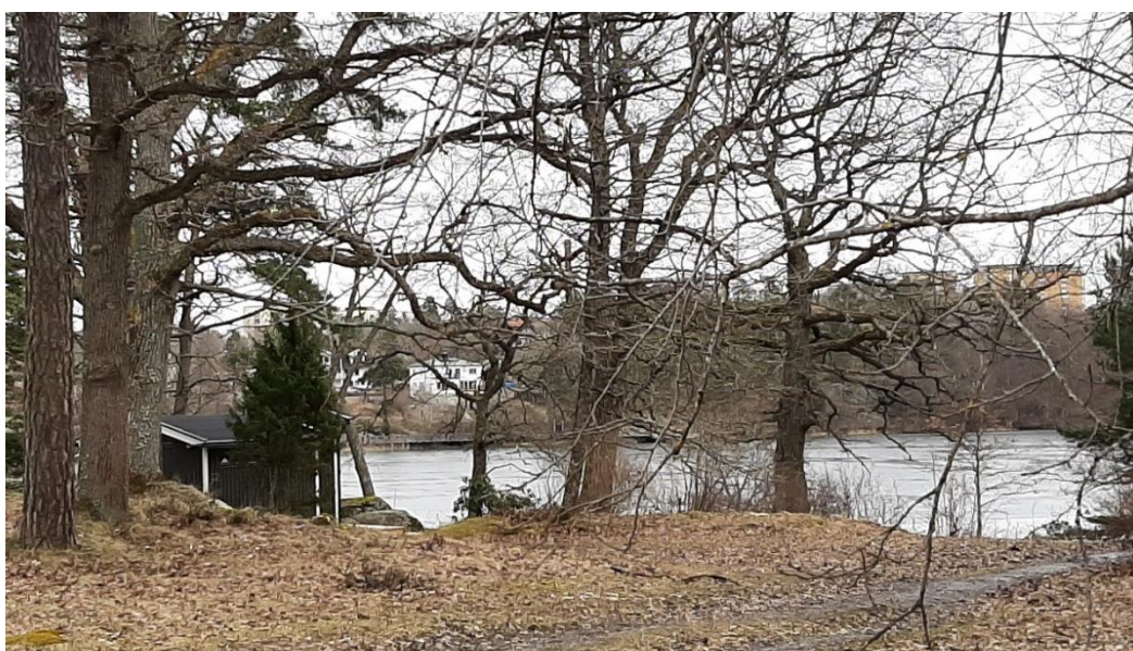
På andra sidan av sjön Magelungen skymtar bebyggelsen i Farsta.