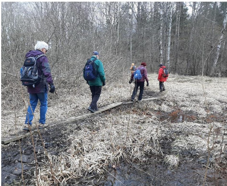
Sen bar det iväg igen med omväxlande fuktig mark och torrare partier.