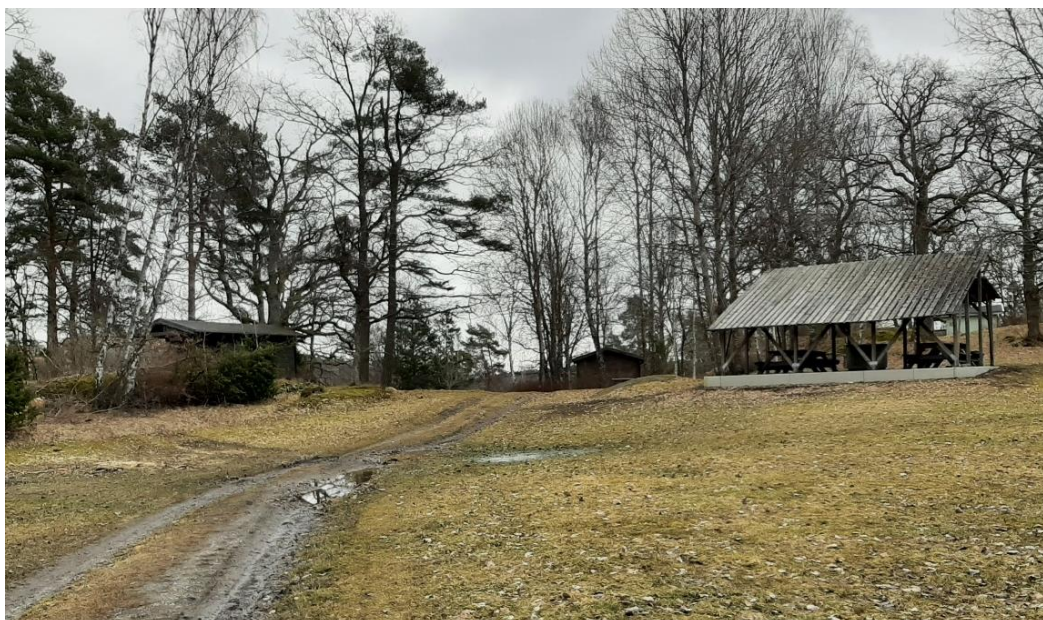
En grillplats under tak med bänkar och bord var målet.