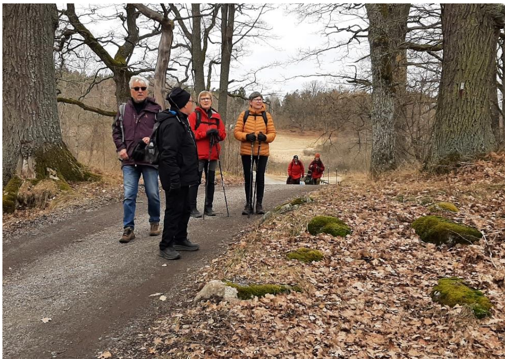
På väg uppför den sista backen mot raststället.