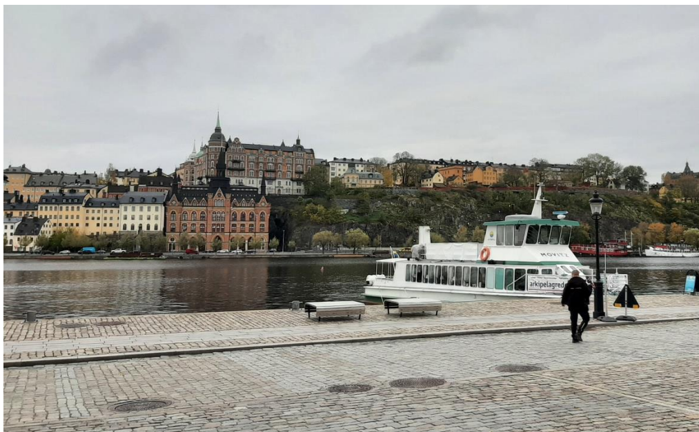
På södra sidan har man fin utsikt mot Södermalm och Mariaberget.