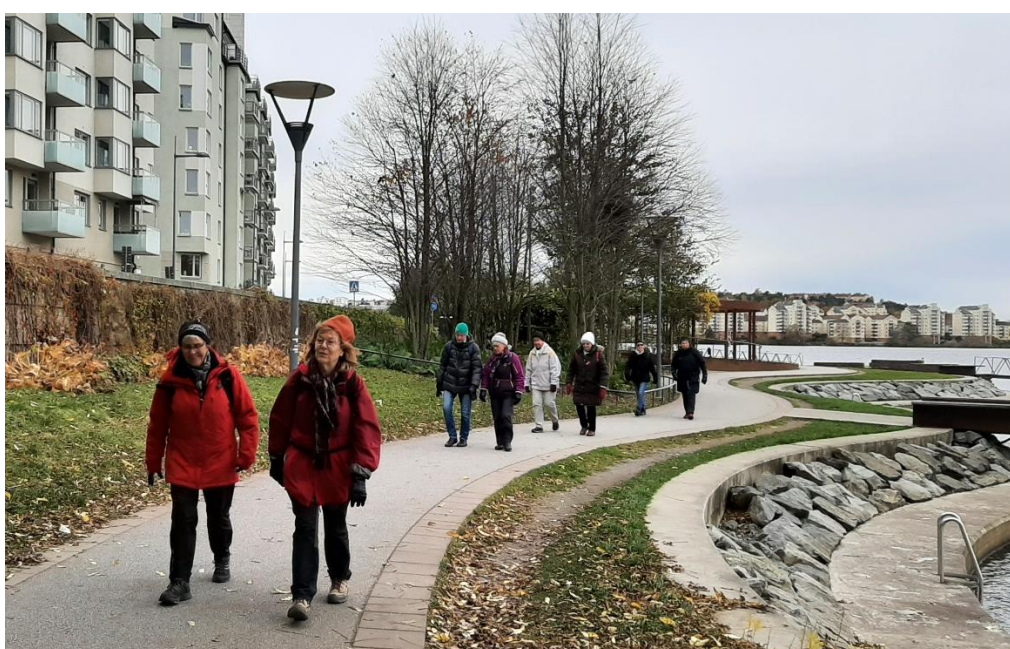
Hornsbergs strandpark har fått en vackert svängd stenläggning.