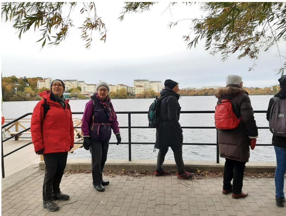
Utsikt över Ulvsundasjön mot Huvudsta.