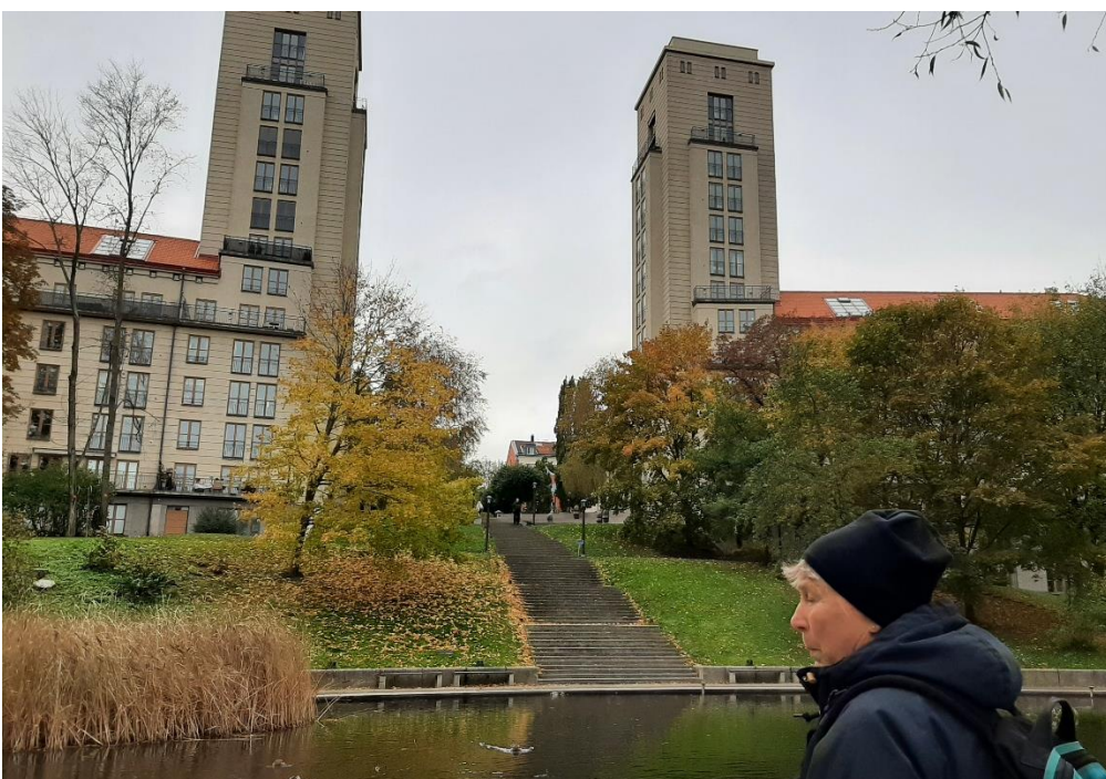
När vi hade passerat S:t Eriksbron kom vi förbi Grubbens trappor, som leder upp till det kulturhistoriskt intressanta Grubbensområdet, ett område som "har gått från misär till en undanskymd Stockholmspärla" enligt SvD.