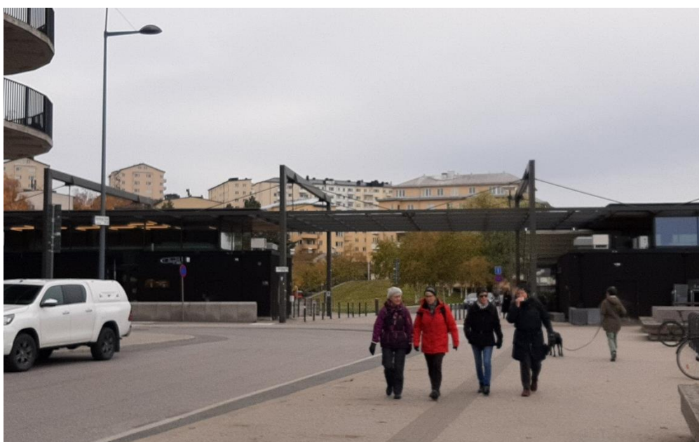
I bakgrunden syntes Minneberg, när vi fortsatte österut mot Karlbergskanalen.