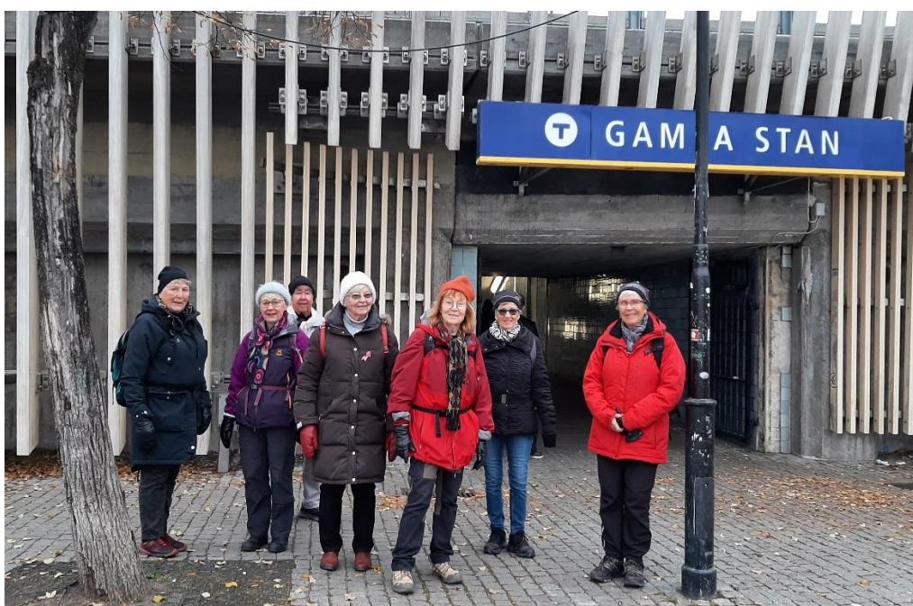
Samling utanför T-banan, där vi som fortsatt avslutade vandringen.