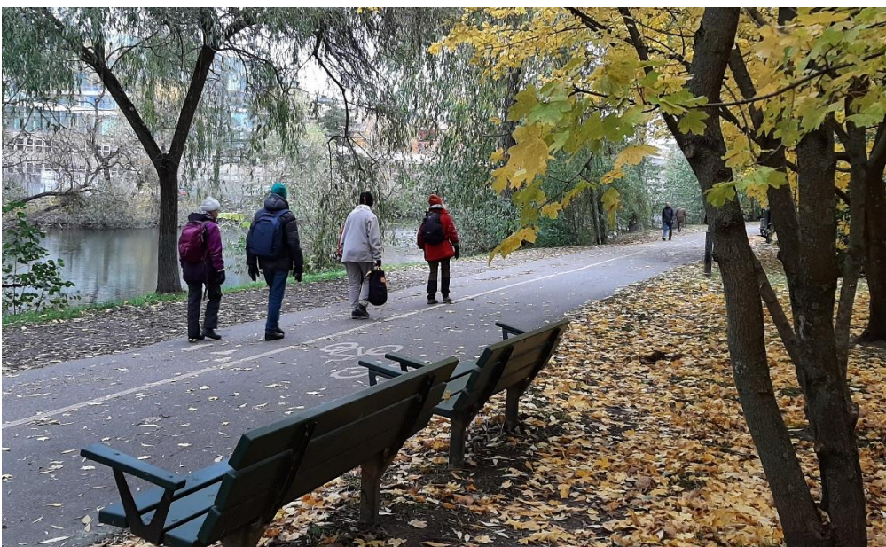
Efter en stärkande rast gick vi vidare i höstlandskapet på Kungsholms strand.