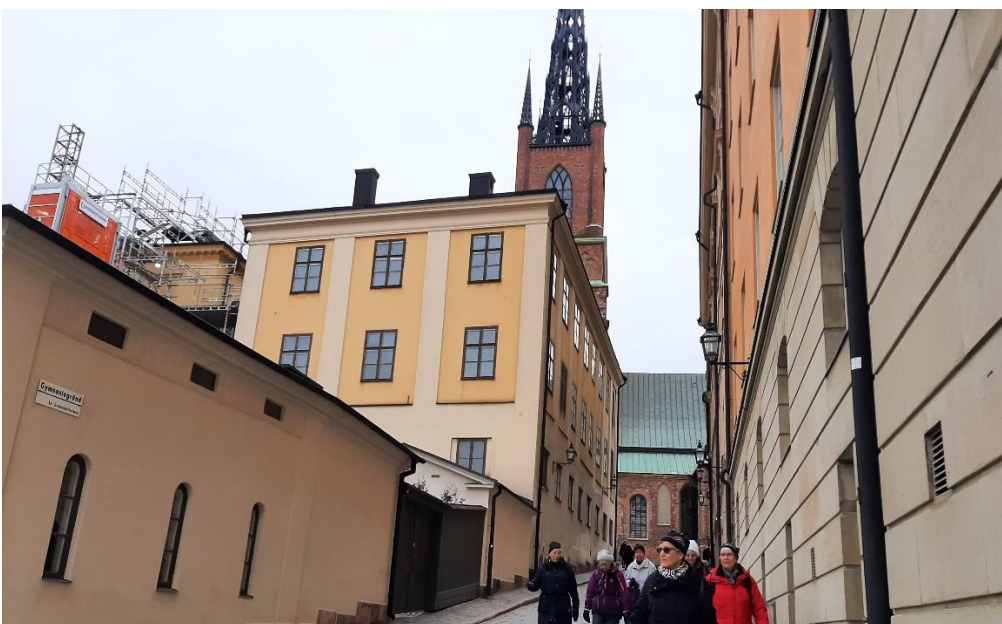
Riddarholmskyrkan var tyvärr stängd, så där kom vi inte in.