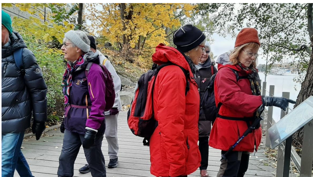
En orienteringstavla finns strategiskt placerad.