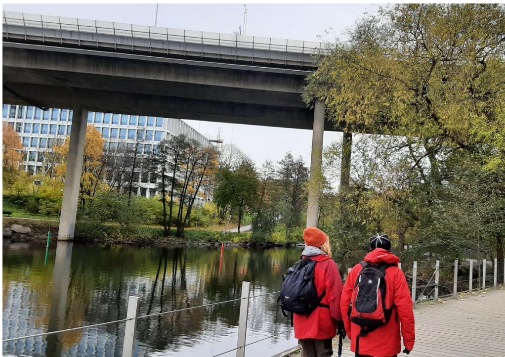
Nästa bro vi passerade var Essingeleden högt där ovanför.