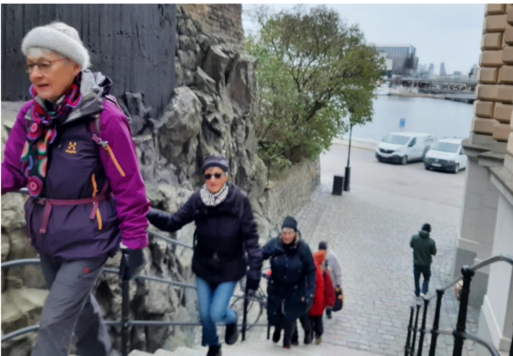
De flesta av oss ville inte avsluta vandringen redan där, utan vi fortsatte till Riddarholmen.