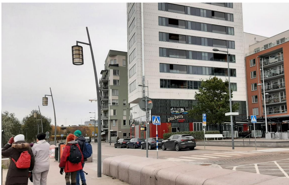
Vi passerade Moa Martinssons torg.