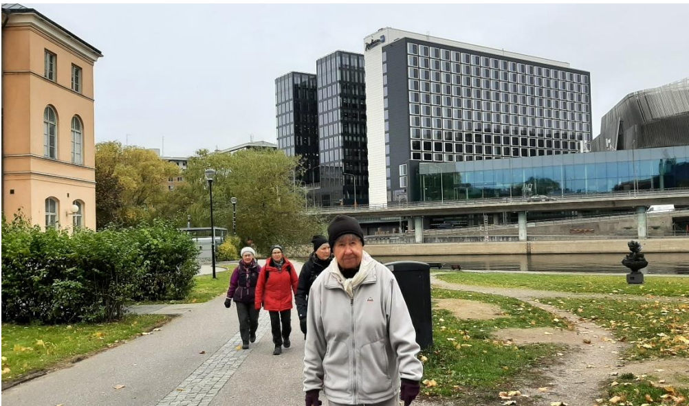
Här har vi svängt förbi det gamla Serafimerlasarettet upp mot Stadshusbron.