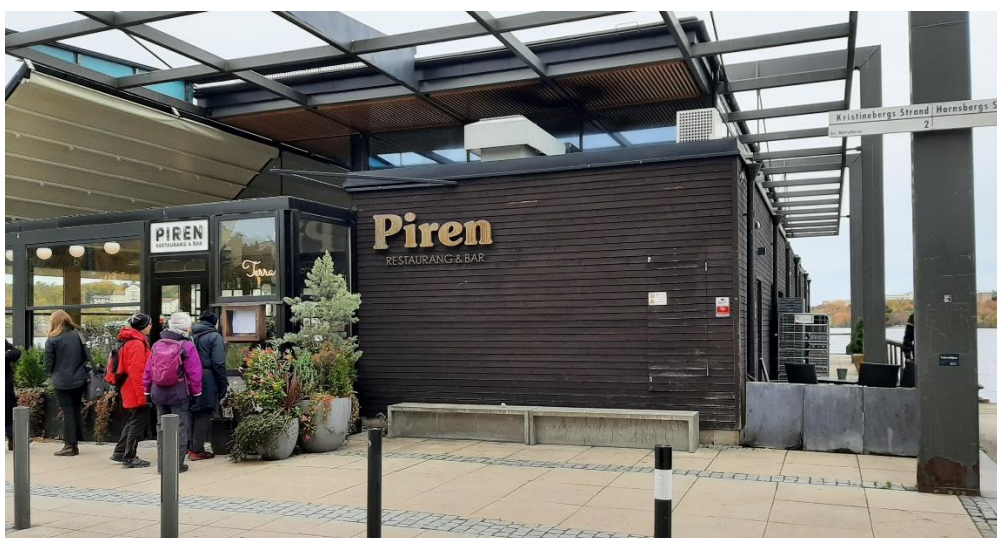
Vid restaurang Piren övergår Kristinebergs strand till Hornsbergs strand.