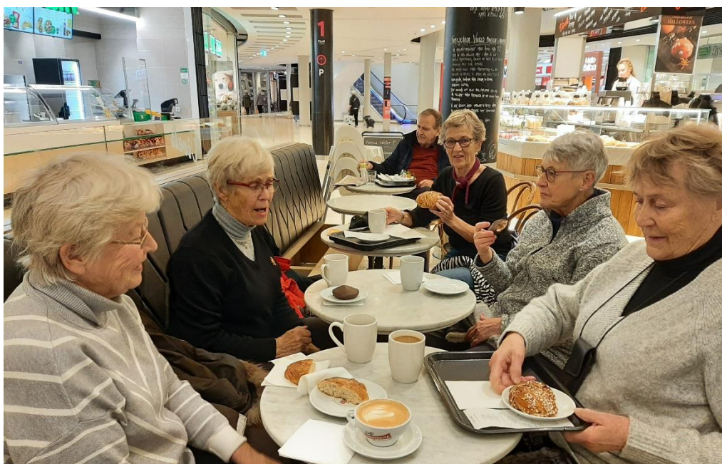
Men en avslutande fika i Liljeholmens galleria blev det förstås också.