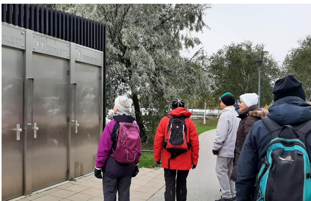
Snygga toaletter är inte fel, när man är ute och vandrar i stan.