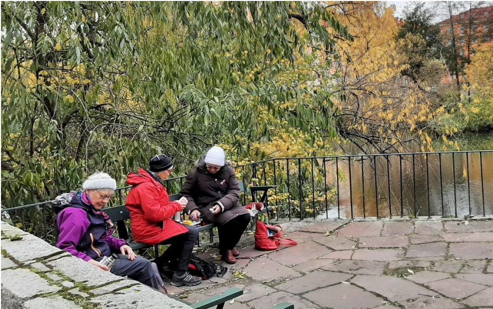
Läget vid Karlbergssjöns vatten var lugnt och trevligt.